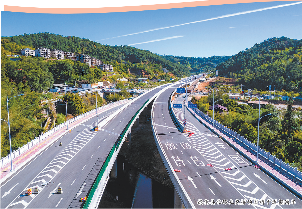
德化县北环路立交桥项目将于近期通车