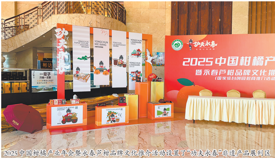
2025中国柑橘产业年会暨永春芦柑品牌文化推介活动设置了“功夫永春”非遗产品展区

级。如今,永春芦柑、佛手茶、岵山荔枝等核心农产品已全面纳入品牌体系,其中永春芦柑、岵山荔枝跻身中国果品区域公用品牌价值榜百强,佛手茶入选中国茶叶区域公用品牌价值榜百强,品牌硬实力获得权威认可。在此基础上,永春建立量子溯源授权机制,以政府信用为优质农产品背书,为农文旅融合奠定了坚实的品质基础。