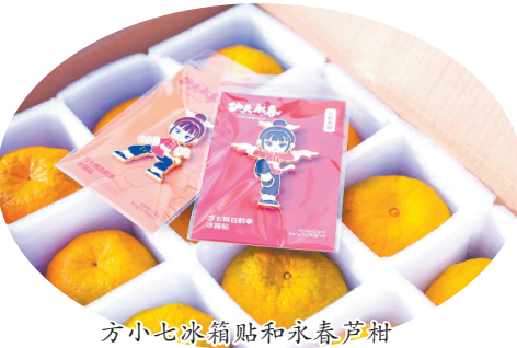
方小七冰箱贴和永春芦柑

近年来,面对农产品品牌“小而散”,附加值不高等问题,永春县立足资源禀赋,系统谋划打造“功夫永春”区域公用品牌,巧妙融合地域文化精髓——以源自本地的永春白鹤拳为精神内核,以白鹤拳创始人方七娘为原型打造特色IP,将纸织画纹理、东关桥、漆篮编织等地域元素融入产品包装,实现“一产一品、一品一韵”的品牌形象升