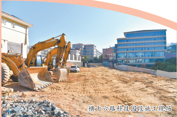
横十六路科技园段施工现场