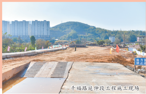
千福路延伸段工程施工现场

介绍,立交桥通车后,不仅缓解了区域交通压力,更拉近了县城北部与工业园区的联系,便利了市民出行和货物运输。