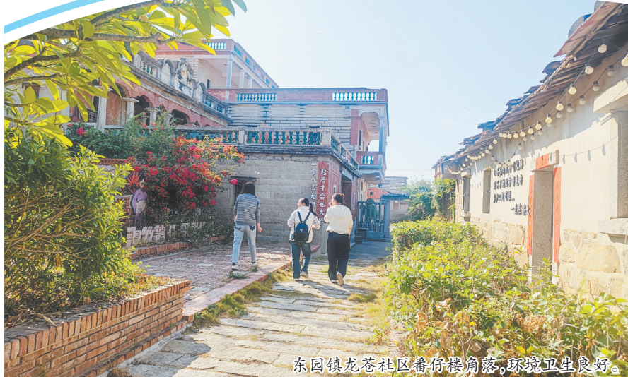
东园镇龙苍社区番仔楼角巷,环境卫生良好。