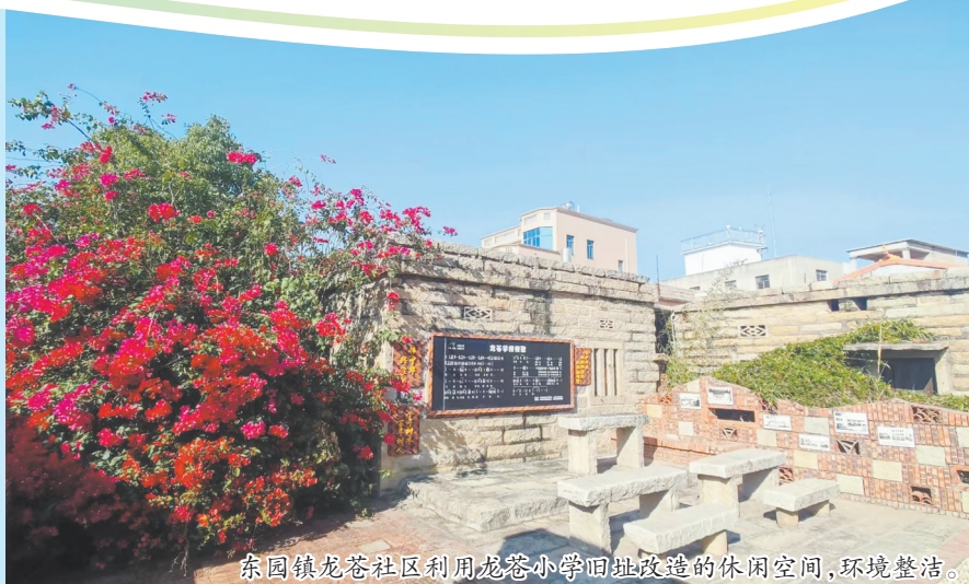
东园镇龙苍社区利用龙苍小学旧址改造的休闲空间,环境整洁。

近日,记者跟随泉州市城管局考评中心工作人员走进泉州台商区东园镇龙苍社区。只见红砖古厝间的水泥路干净整洁,番仔楼旁的三角梅艳如云霞,连墙角的青苔都透着清爽气息。记者采访发现,这般洁净雅致的人居环境,源于东园镇深入推行的精细化保洁模式。