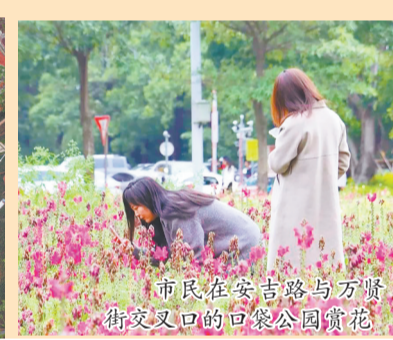
市民在安吉路与万贤街交叉路口的口袋公园赏花