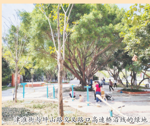
津淮街与坪山路交叉路口高边桥沿线的绿地