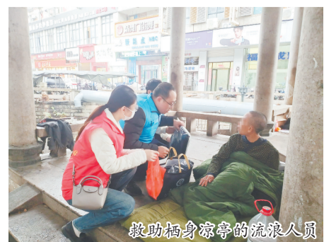
救助满身凉亭的流浪人员

据悉,专项行动开展以来,泉州市救助站联动街道、社区、公安等多方力量,开展线上线下各类救助活动,截至目前共计救助328人次。