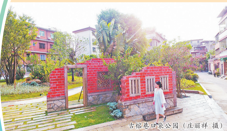
古榕巷口袋公园