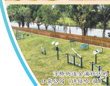
浮桥街道金浦社区的口袋公园