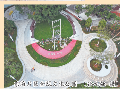
东海片区金瓯文化公园