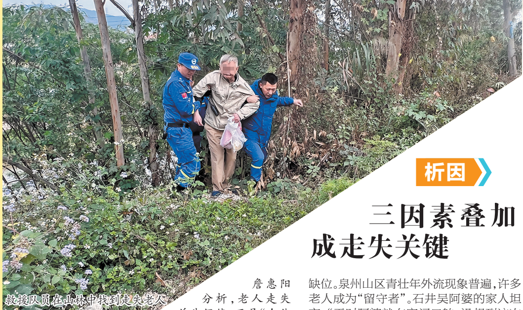
救援队员在丛林中找到走失老人