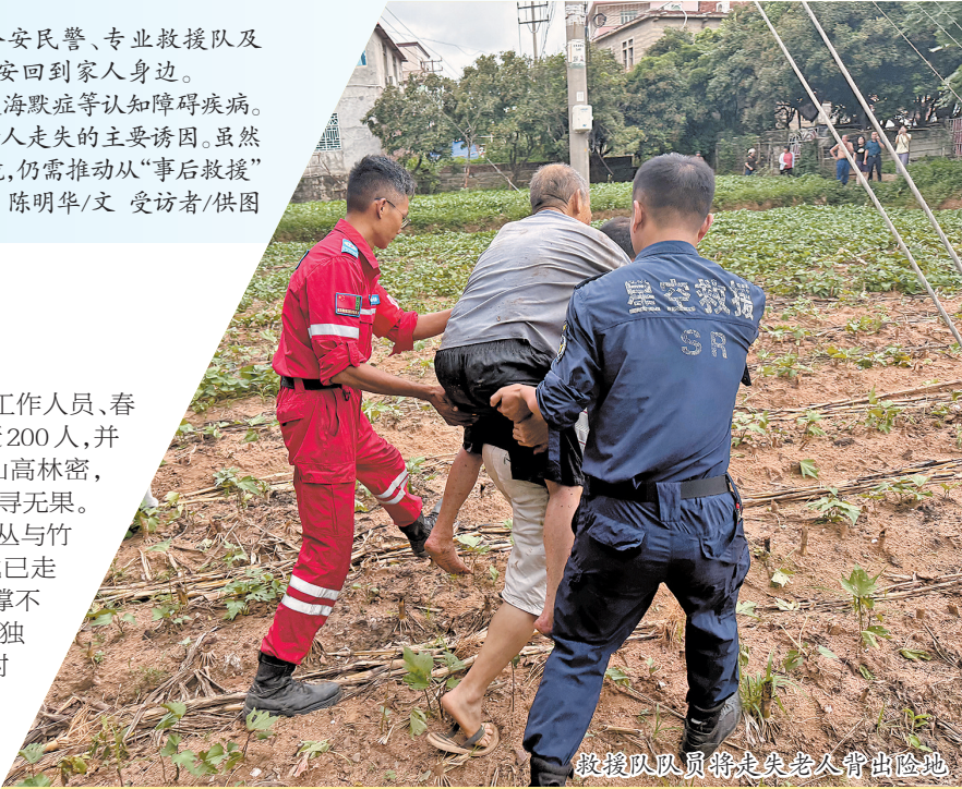
救援队队员将走失老人背出险地