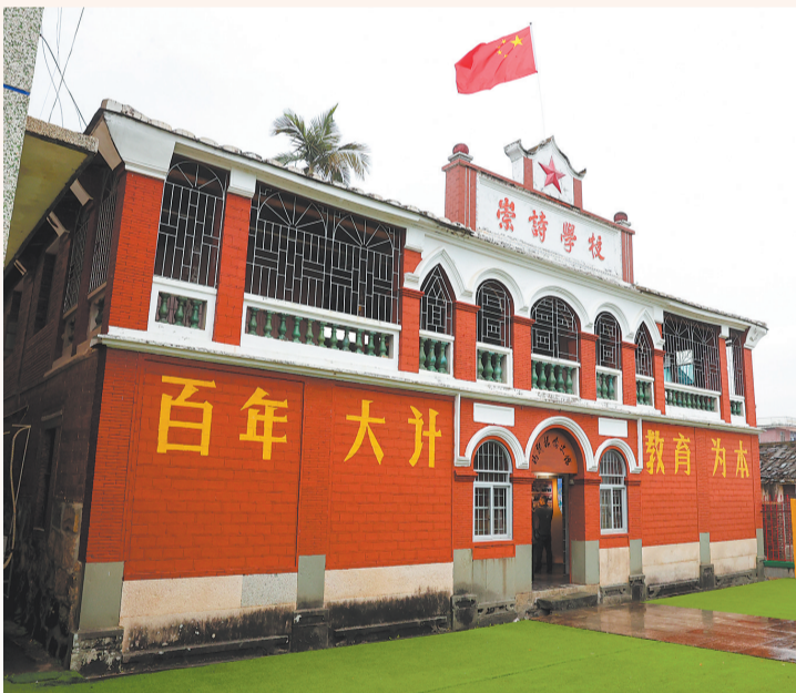
码头镇侨史馆原为崇诗学校