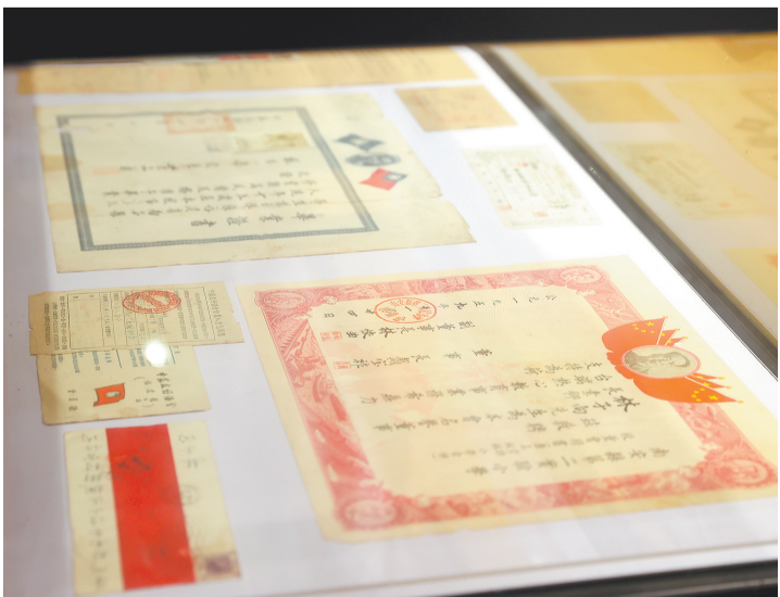
展厅内收藏了不少涉侨历史物件