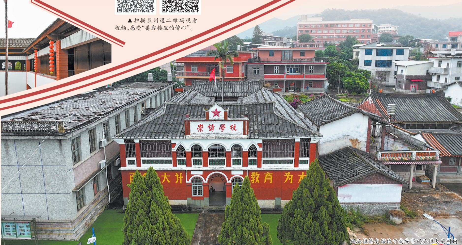
码头镇侨史馆位于南安市码头镇大庭村内