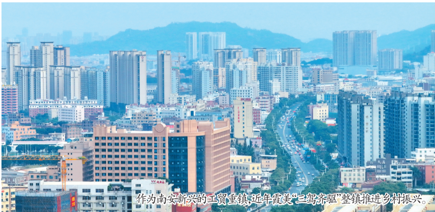
作为南安新兴的工贸重镇,近年霞美“三驾齐驱”整镇推进乡村振兴。