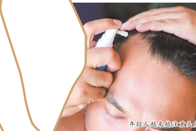
年轻人越来越注重头皮养护