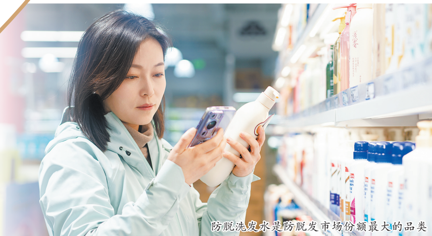
防脱洗发水是防脱发市场份额最大的品类