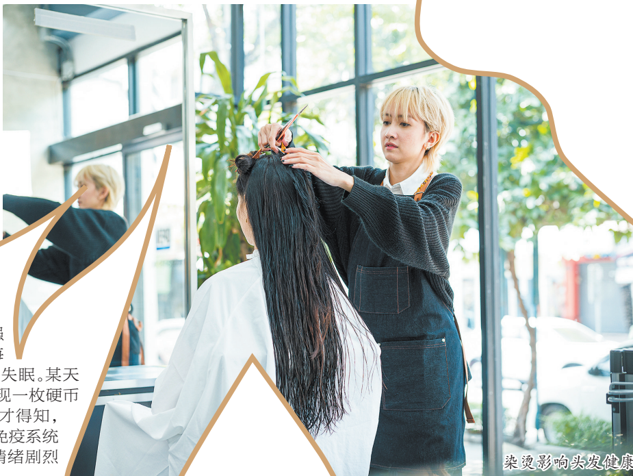
染发影响头发健康