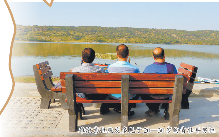
雄激素性脱发多见于20—30岁的青壮年男性

此外,消费者应留存消费凭证维权。购买时,需保存好发票、订单截图、产品宣传页面等凭证,若使用后发现产品存在头皮刺激、无防脱效果等质量问题,或核实产品宣传与新规范要求不符,可及时向市场监管部门投诉,依法维护自身合法权益。