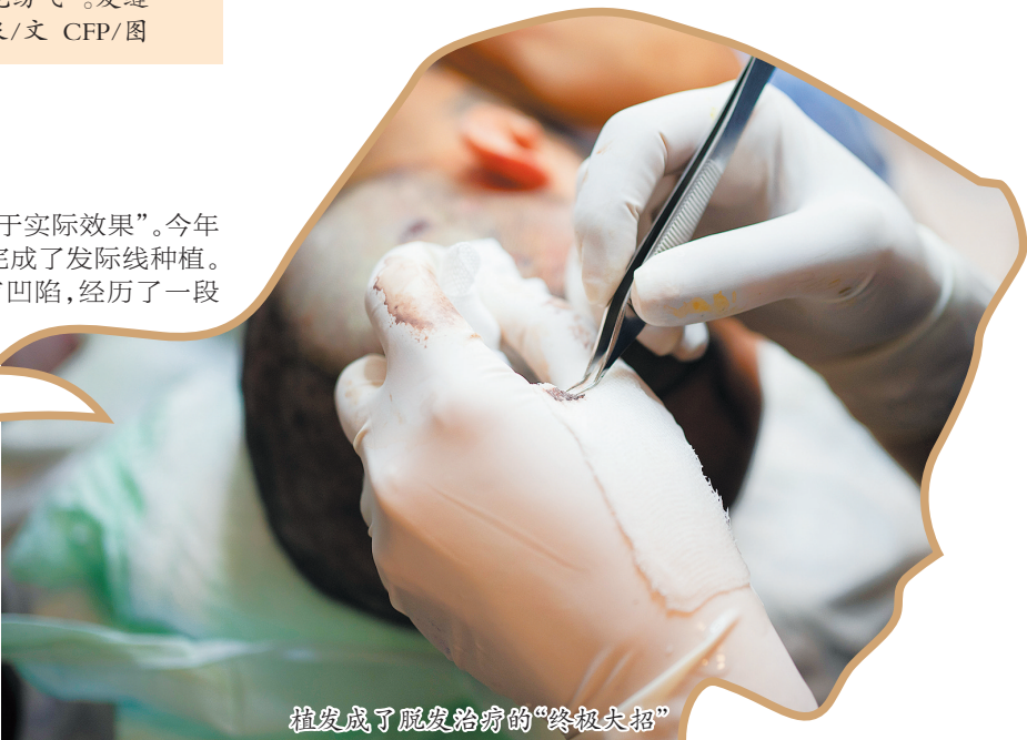
植发成了脱发治疗的“终极大招”

爱美也可能成为脱发的隐形推手。频繁地烫发、染发,使用的药水可能损伤头皮屏障,引发接触性皮炎;过紧的马尾辫、丸子头等发型造成长期牵拉,会导致牵引性脱发;甚至一些不正确的梳头、洗护方式,都在日积月累中伤害着毛囊健康。节食减肥导致蛋白质、维生素和微量元素摄入不足,会影响头发的正常生长,诱发休止期脱发。