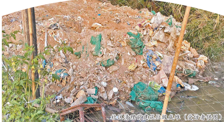
社区清理前建筑垃圾成堆