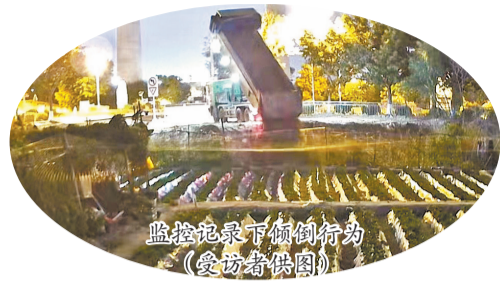
监控记录下倾倒行为

近日,有市民拨打本社24小时热线96339反映,晋江梧林传统村落景区大门对面的农田被人倾倒大量建筑垃圾,殃及周边的农田和水塘,给农户造成一定经济损失。记者就此前往现场走访,核实相关情况。□融媒体记者 苏珊榕 张晓玲 文/图(除署名外)