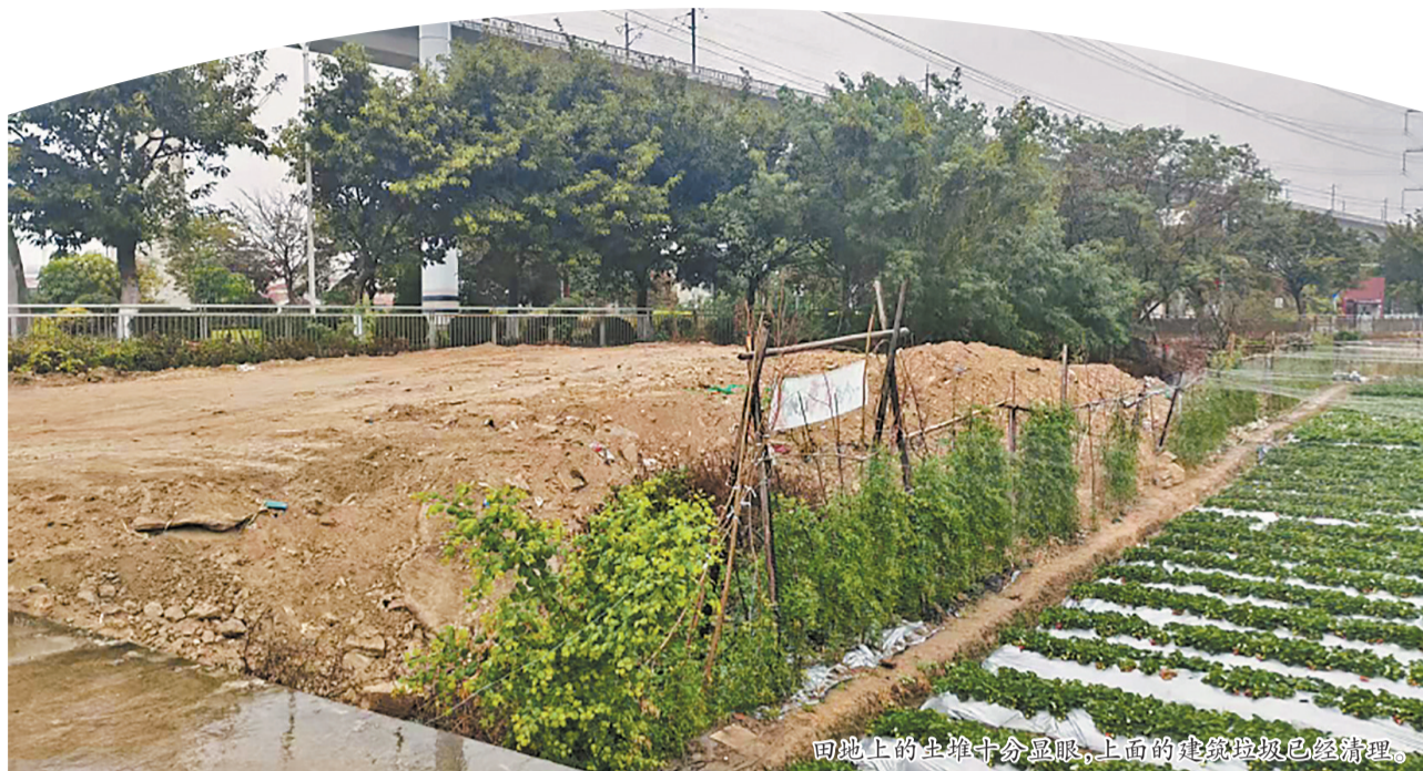
田地上的土堆十分显眼,上面的建筑垃圾已经清理。

近日,有市民拨打本社24小时热线96339反映,晋江梧林传统村落景区大门对面的农田被人倾倒大量建筑垃圾,殃及周边的农田和水塘,给农户造成一定经济损失。记者就此前往现场走访,核实相关情况。□融媒体记者 苏珊榕 张晓玲 文/图(除署名外)