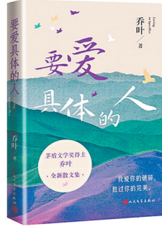
《要爱具体的人》 乔叶著 人民文学出版社

乔叶用文字告诉我们,所谓幸福,从来不在抽象的想象里,而在具体的问候、真切的陪伴、细微的理解中。爱具体的人,就是爱这热气腾腾的人间。