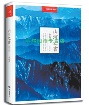
《山河之书》 余秋雨著 岳麓书社

合上《山河之书》,我不由心有所感,家国情怀,并非遥不可及的口号标语,它就植于我们每个人的岗位与生活中。无数小家的“和”,方能成就大家的“安”。多少平凡的坚守,为波澜壮阔的《山河之书》,增添温暖而有力的注脚。