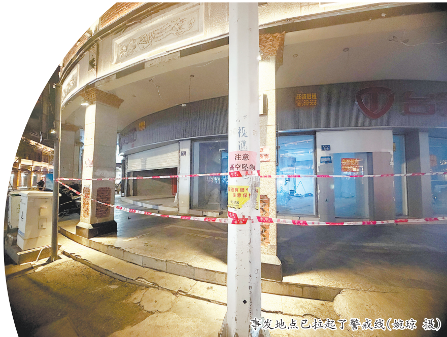
事发地点已拉起了警戒线