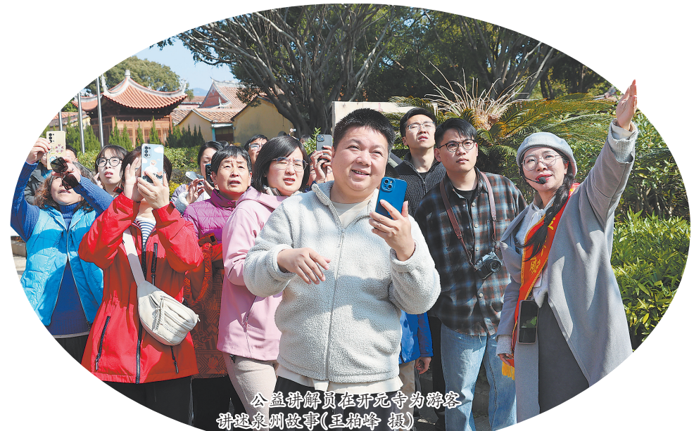
公益讲解员在开元寺为游客讲述泉州故事

站2个示范点,逐步拓展至民宿、酒店及文化空间等近50个点位,搭建起一张有温度的服务网络。这些驿站不断增加服务内容,广泛发放《古城手绘地图》《中英文旅游宣传手册》等,多维度构建起人性化、国际化的旅游咨询服务,让外国游客也能感受到这座城市的细致与周到。