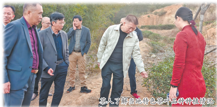
茶人了解当地特色茶叶品种种植情况

本报讯(融媒体记者庄建平 谢伟端 文/图)近日,泉州市茶叶学会组织相关茶企、加工企业负责人,有关管理部门、农业科研机构代表,前往惠安县、泉港区调研茶产业,旨在更加准确地掌握泉州茶叶产业发展态势,跟踪茶叶优势产区发展动态,分享重点企业和重点品牌的典型经验,进一步推动泉州茶产业高质量发展。