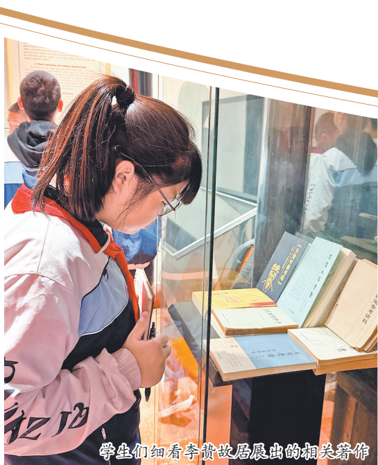
学生们细看李贽故居展出的相关著作

本报讯(融媒体记者陈森森 通讯员庄晓茹 文/图)近日,泉州七中组织该校卓吾书院师生参观李贽故居、天后宫、德济门遗址,通过实地走访和听取讲解,进一步了解世遗泉州深厚的历史文化和身边的历史文化名人,增强文化自信,启蒙学术研究之路。