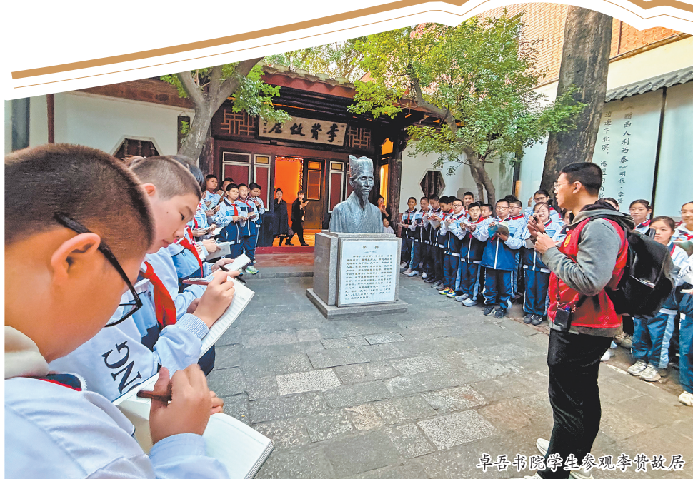
卓吾书院学生参观李贽故居