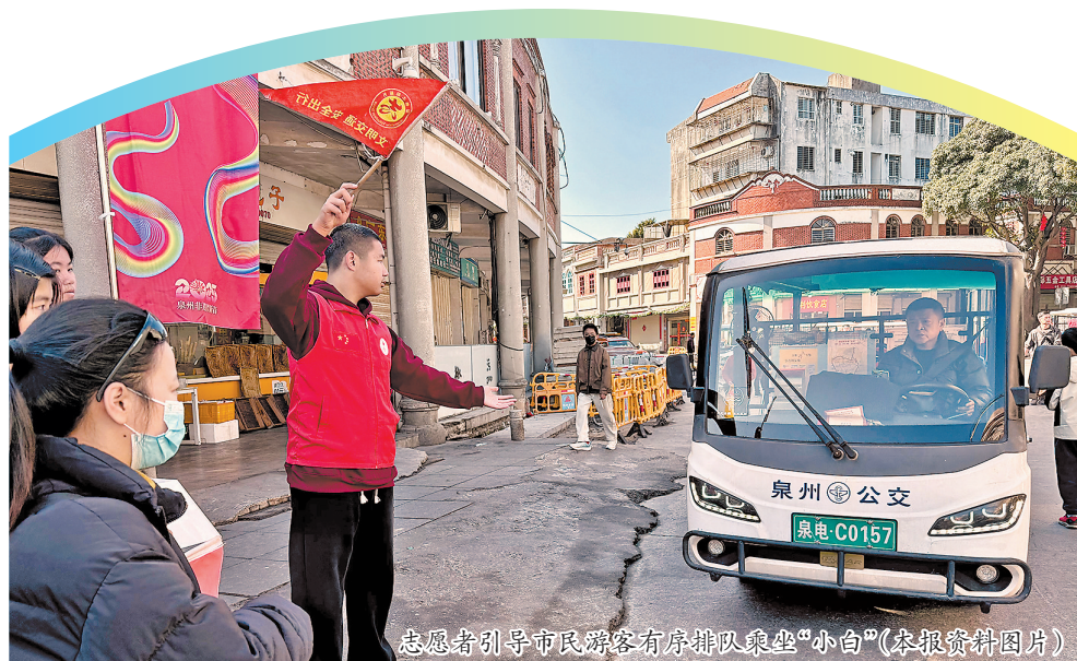
志愿者引导市民游客有序排队乘坐“小白”

为了让优质服务有章可循,我市着力完善规范与标准。文旅部门牵头修订完善旅游景区、星级饭店、旅行社等服务规范和标准,将“文明服务、诚信经营”融入行业血液。目前,全市A级旅游景区已全面推行“微笑服务”和“首问负责制”,并优化游客投诉处理流程。同时,通过健全旅游行业信用信息记录、共