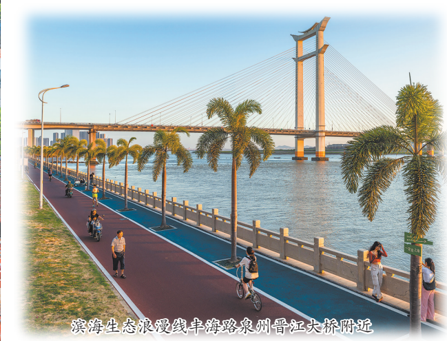
滨海生态浪漫线串联泉州晋江东桥附近