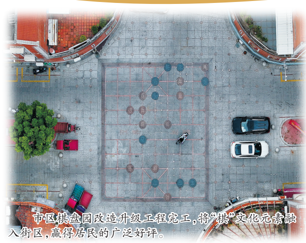
市桥联合公司改造并升级工程完工,将“烂路”变为民路