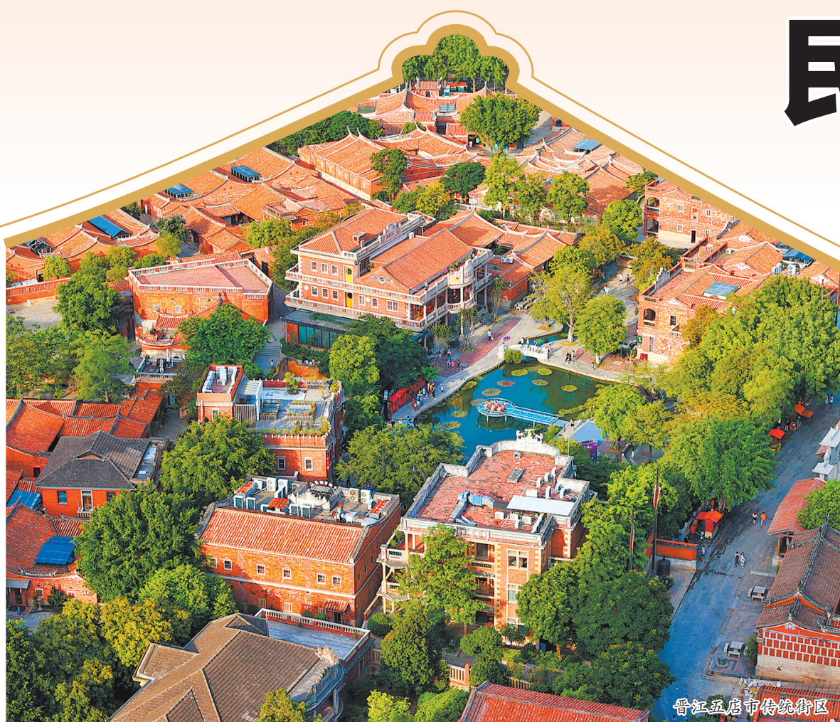
晋江旧唐寺传统街区

河畅其流、鹭鸟翩跹,天朗气清、绿意满城,城郭秀美、街巷明净……近年来,泉州在生态修复、绿色转型等领域持续发力,为生态宜居画卷绘就幸福底色。山水交融,生态连通。为更好践行“两山”理念,泉州在2017年创造性提出“生态连廊带”概念,希冀用绿道串起山、水、林、田、湖、草等自然资源,形成相互贯通、连绵成片的城镇生态网络。如今,遍布城乡的1302公里福道已成为群众休闲健身的“打卡点”,20公里的“滨海生态浪漫线”串联起晋江、洛阳江与泉州湾,融入烟火市集等业态,带给市民游客不一样的泉州夜生活。