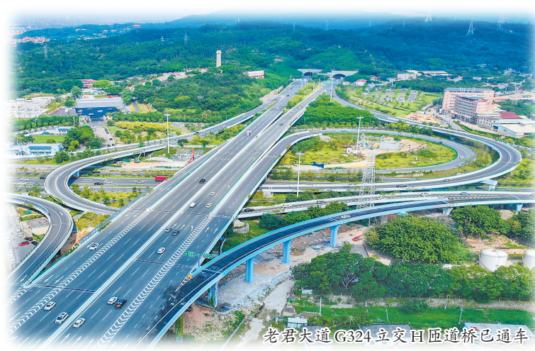
老君大道G324立交匝道随建桥已通车