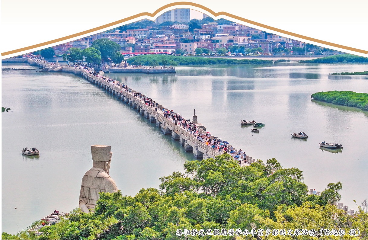
洛阳桥元旦假期将举办丰富多彩的文旅活动。