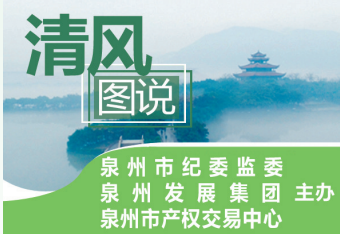
泉州市纪委监委 泉州发展集团 主办 泉州市产权交易中心