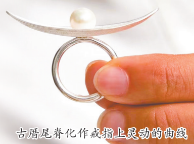
古厝尾脊化作戒指上灵动的曲线