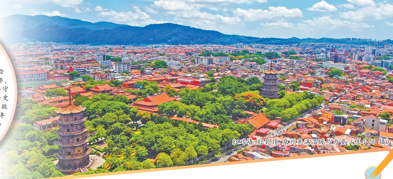
红砖墙、红瓦顶,泉州充满温暖与力量。

一座城,千种风情,万种旅程印记。岁启2026年,泉州,这座世遗之城在不同人的眼中,正映照出截然不同的光彩。 记者采访了四位来泉或在泉的“体验者”:从“极繁美学”中捕捉灵感的旅居设计师、在“茶香生活”里找到松弛感的法国姑娘、坚守非遗的本地花灯传承人、用专业深度诠释历史厚度的古城讲解员,聆听他们与这座城市的故事,以及对新一年的期许。世遗泉州鲜活、丰盛、饱含温度的立体文旅魅力,正通过人与城的双向奔赴,持续生长、绽放。 □融媒体记者 洪娜娜/文