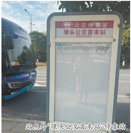
站点外“埭头公交首末站”停靠站