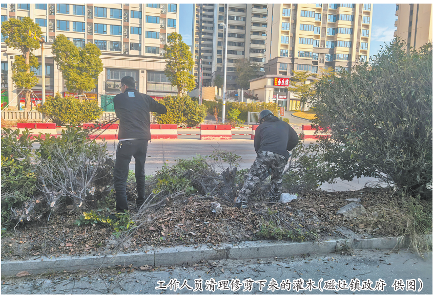
工作人员清理修剪下来的灌木

本报讯(融媒体记者张小玲)318县道晋江市磁灶镇纵二路路口至东昇路路口路段,机动车道和非机动车道之间的隔离绿化带灌木太茂盛,容易遮挡视线且刚蹭过往市民。去年12月25日,本报对此事进行报道并转给晋江市磁灶镇政府处理。昨日,记者获悉,该段绿化带灌木已经修剪。