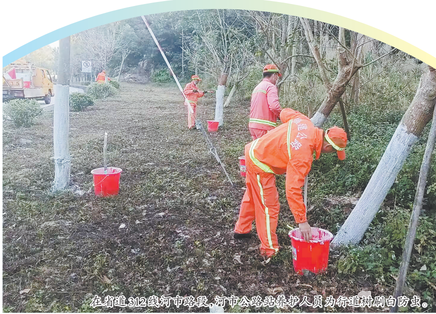
在省道312线河市路段,河市公路站养护人员为行道树刷白防虫。

市公路分中心相关负责人表示,下一步将聚焦路基、安防设施、桥梁、隧道等关键领域和部位,建立隐患排查整治闭环管理机制,对发现的问题立行立改、举一反三,全力保障公路通行安全畅通。结合冬季低温天气特点,还将紧盯山区公路易结冰路段,提前备足融雪除冰物资,完善应急预案,加强应急值守,做到防患于未然,筑牢冬季公路安全防线。