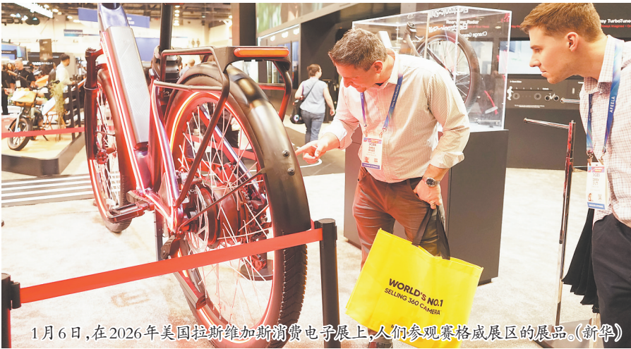
1月6日,在2026年美国拉斯维加斯消费电子展上,人们参观赛格威展区的展品。

CES 2026主办方美国消费者技术协会执行主席兼CEO夏皮罗也表示,在今天的展会上,AI已经不再被视为一个独立的产品门类或炫技的“插件”,而是成为驱动几乎所有展示设备的底层操作系统。他认为,