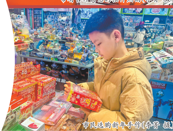
市民选购新年手作