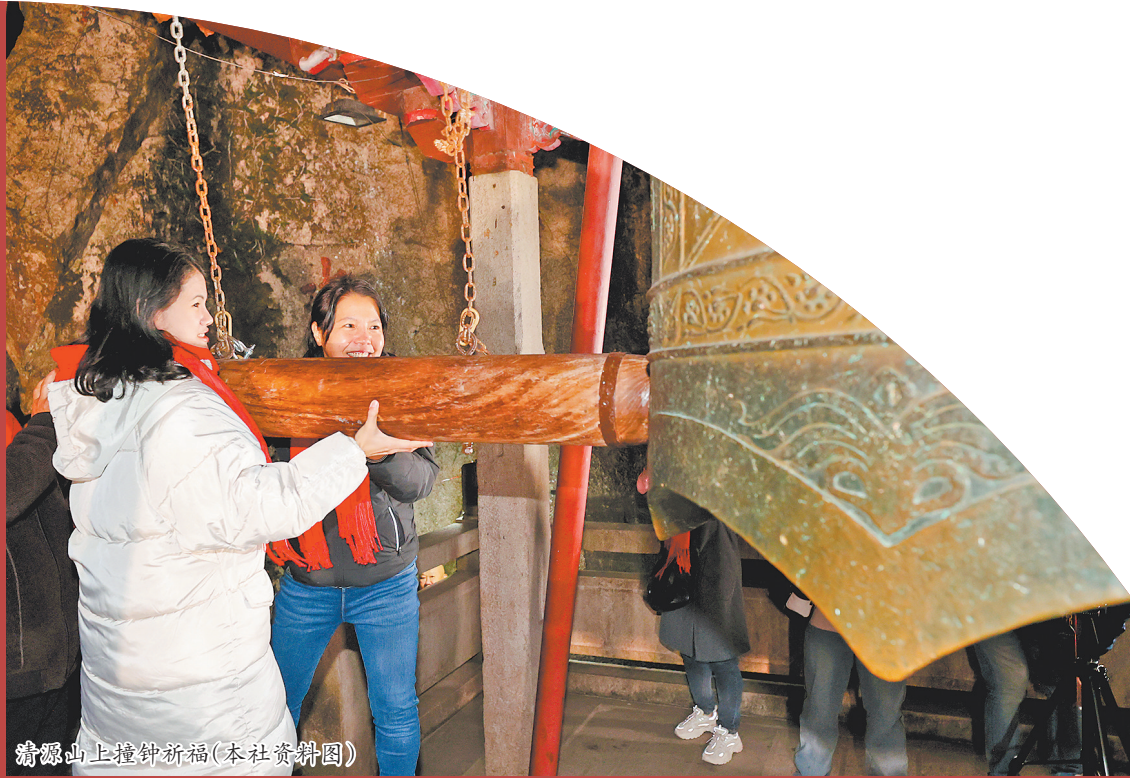
清源山上撞钟祈福

本报讯(融媒体记者李菁)新的一年来了,泉州人的跨年仪式感又上新了。互赠“赛博礼物”、体验二次元陪伴等跳出传统框架的跨年方式悄然走红,成为辞旧迎新新选择。