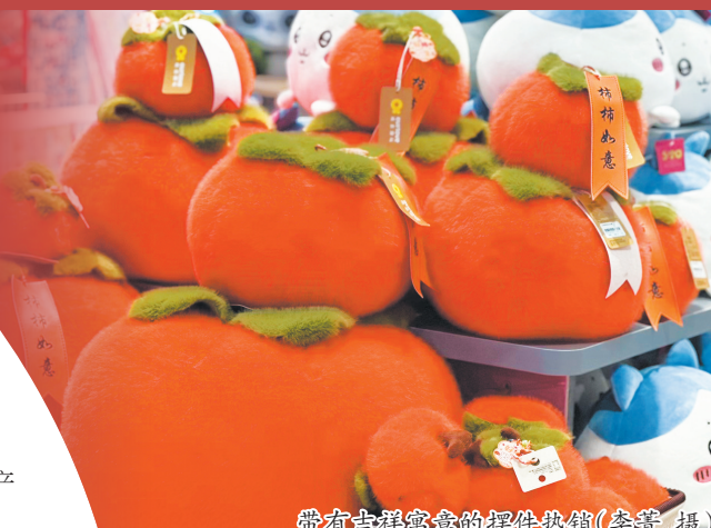
带有吉祥寓意的摆件热销