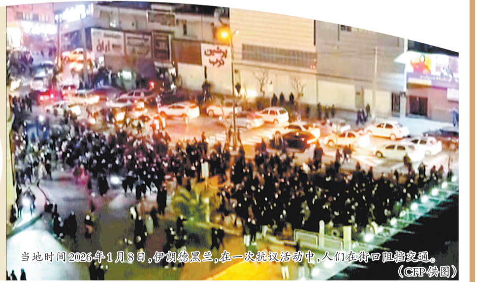
当地时间2026年1月8日,伊朗德黑兰,在一次抗议活动中,人们在街口阻挡交通。

步入2026年,中东地区在挑战与机遇交织的变局中探索前行。伊朗局势走向何方?加沙战火能否彻底熄灭?叙利亚、苏丹、也门等热点地区的冲突风险将如何演变?这三大热点,共同勾勒出新的一年中东局势发展的关键脉络。