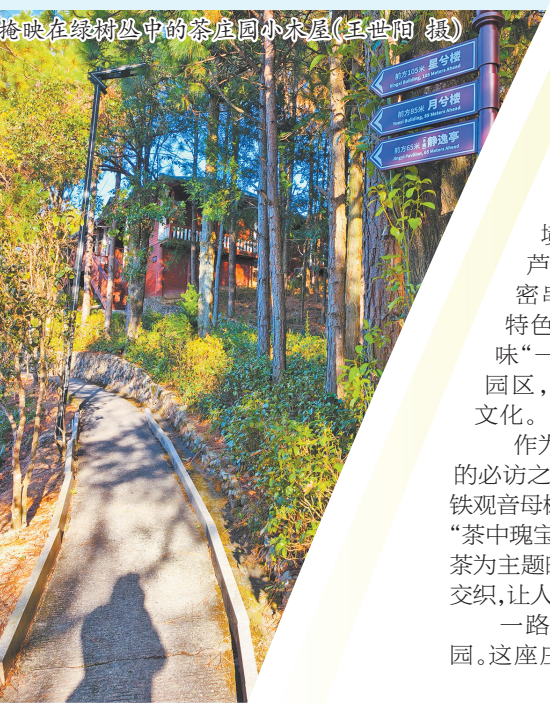
掩映在绿树丛中的茶庄园小茶屋

国道228线被誉为中国最长海岸线国道,亦享有中国“最美沿海公路”的美誉。其泉州段全长223公里,由北至南依次经过泉港区、惠安县、泉州台商投资区、丰泽区、晋江市、石狮市、南安市,沿线串联起8处世界文化遗存点,融合自然人文风情与海丝底蕴,一路见证着这座古港的千年风韵,是泉州自驾版图中极具特色的滨海人文线路。