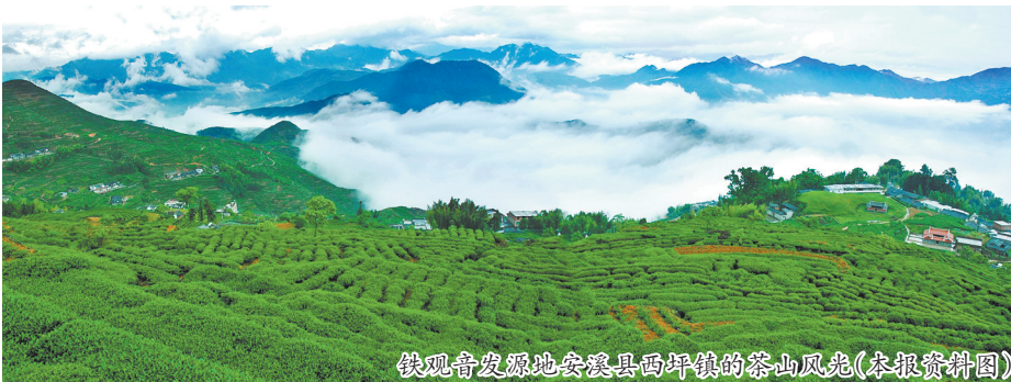
铁观音发源地安溪西坪镇的茶山风光(本报资料图)

沿着国道358线安溪段行驶,道路在连绵的茶山之间舒展,清新的茶香随风扑面而来,一场“闻香寻韵”的茶山秘境之旅就此开启。该线将西坪镇、芦田镇、龙涓镇等核心茶叶产区紧密串联,汇集了众多茶产业基地与特色茶庄园,游客不仅可以沉浸式品味“一茶三香”,沿途还可深入茶产业园区,深入解锁安溪各区域独特的茶文化。