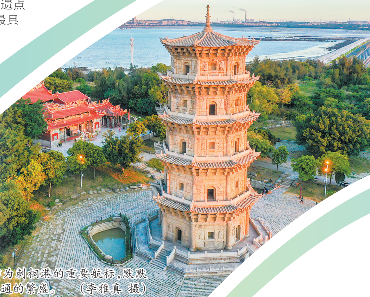
六胜塔作为刺桐港的重要航标,默默见证着海外交通的繁盛。

这条线路的魅力,更在于与海相生的人文古迹串珠成链,值得停车驻足细细探寻。行至泉州台商投资区段,可解锁世遗点之一的洛阳桥。作为中国现存最早、最具代表性的跨海桥梁,它首创筏型基础、浮运架桥、种蛎固基的造桥技术,是历史教科书中的中国四大古桥之一。桥中罕见的纪年文物“月光菩萨”造像庄严凝重,与古