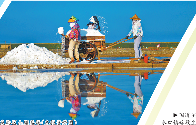
泉港区山腰盐场(本报资料图)