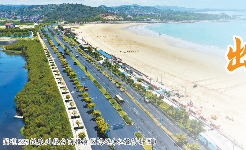
国道228线泉州段台商投资区海边(本报资料图)

此桥”的气魄横跨海湾,永宁古城则遍布着城隍庙、慈航亭、文祠、大夫第等近千年的历史印记……宋元海丝的文化基因,就这样深深融入沿途的每一处风景,静候每一位自驾者前来阅读、聆听与感悟。