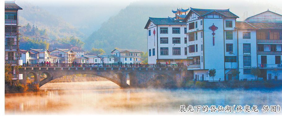
晨光下的岱仙湖

从泉州中心市区出发,沿泉南高速转至国道355线,约2个小时可抵达位于德化东北部水口镇境内的石牛山景区。景区内汇聚了岱仙瀑布、石牛山地质博物馆、石壶祖殿、绿野仙踪、石牛山顶峰等诸多核心景点,兼具自然奇景与人文底蕴。主峰海拔1782米,是福建少有的高海拔雾凇观赏地,到特定的寒冬时节,便成了银装素裹的冰雪童