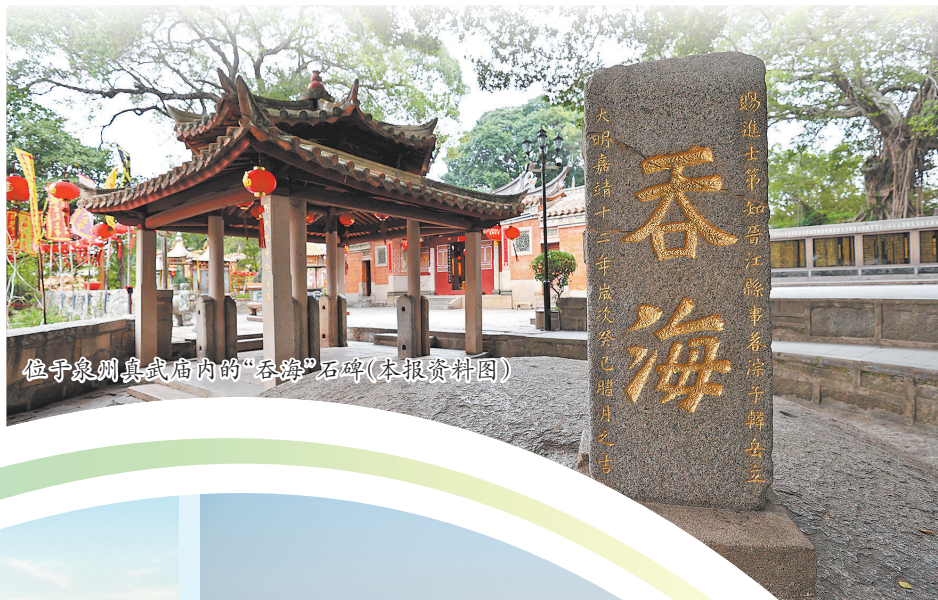
位于泉州真武庙内的“吞海”石碑