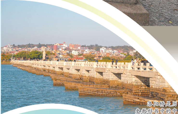
洛阳桥是历史教科书中的中国四大古桥之一,也是泉州22个世遗点之一。