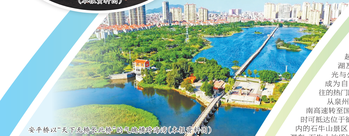
安平桥以“天下无桥长此桥”的气魄横跨海湾