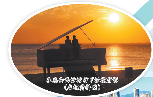
在惠安西沙湾留下浪漫剪影(本报资料图)