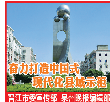
晋江市委宣传部 泉州晚报编辑部