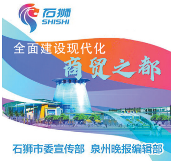
石狮市委宣传部 泉州晚报编辑部