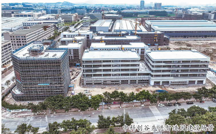
中科创谷先进智造园建设场景

本报讯 一砖一瓦,精工至善。笔者日前从位于石狮高新区的中科创谷先进智造园获悉,该产业园建设扎实推进,进度条不断刷新,目前已有7栋厂房落架,基本完成内外部装修,还有多栋厂房建设有序进行。