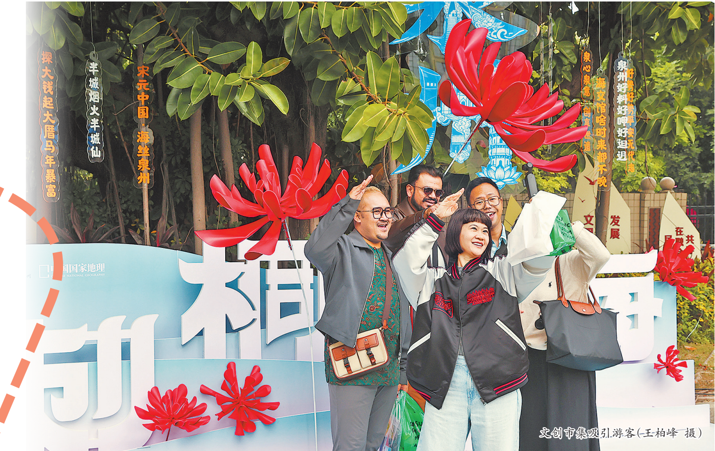
文创市集吸引游客