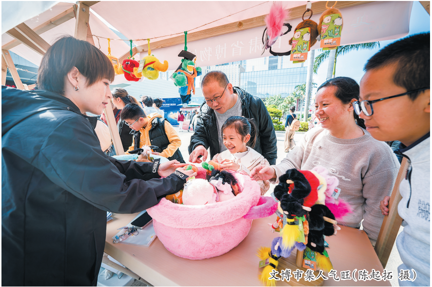
文博市集人气旺

福建省闽南文化非遗周重要配套活动之一的“山海交融 寻味闽南”非遗美食市集在这里启动。50个特色摊位沿广场整齐排开,各种闽南美食瞬间点燃了现场市民游客的热情,还有泉州砖雕、妆糕人等非遗让人爱不释手。 业内人士认为,非遗集市有效连接非遗与市场,激发文化创造力,赋予古老技艺现代生命力。它们繁荣了在地文旅消费,传播了闽南文化,成为吸引八方游客、助推泉州文旅高质量发展的特色名片和活力源泉。