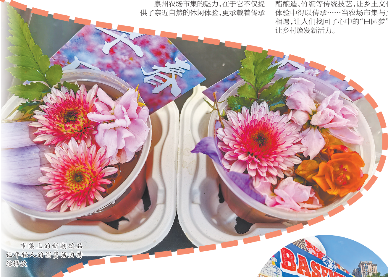
市集上的新潮饮品让年轻人的消费活力持续释放

泉州农场市集的魅力,在于它不仅提供了亲近自然的休闲体验,更承载着传承农耕文化的使命。洛江区“宋时风华·烟火洛江”沉浸式农场市集,以宋代市井生活为蓝本,复原了传统农耕场景,游客可以体验古法春米、磨面、织布等农事活动,在动手实践中感受传统农耕文化的魅力;安溪“一碗百味 烟火乡里”主题市集,将茶乡文化与农场体验结合,游客可以在茶园里采茶、制茶,品尝茶餐、茶点,感受安溪茶文化的深厚底蕴;永春县“永春漫时光”主题农场活动,推出百桌咯摊宴,让游客在田园间品尝地道闽南美食,同时体验醋酿造、竹编等传统技艺,让乡土文化在体验中得以传承……当农场市集与文旅相遇,让人们找回了心中的“田园梦”,更让乡村焕发新活力。