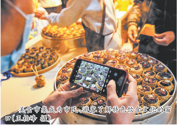
美食市集成为市民、游客了解特色饮食文化的窗口