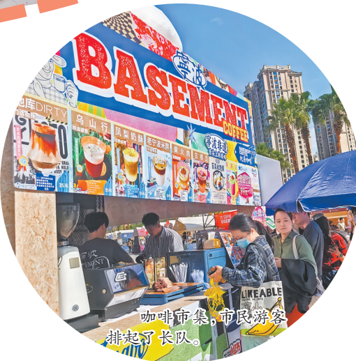
咖啡市集,市民游客排起了长队

从新潮市集的年轻活力,到农场市集的田园野趣,再到非遗市集的文化底蕴,泉州的主题市集正以多元形态编织出一幅全域旅游的美好图景。这些市集不仅是消费的场所,更是文化交流的平台、展示城市活力的窗口。美食抓住年轻人的心,田园让身心回归自然,非遗让文化火起来,泉州这座千年古城在传统与现代的交融中持续焕发魅力。 2026年春节将至,作为世界遗产城市、世界美食之都、闽南文化核心区的泉州,正式推出以“泉州非遗年·生活加点甜”为主题的新春文旅系列活动。本次活动围绕“满城非遗”“闹热烟火”“地道美食”“文创国潮”,策划推出超千项文旅活动及多项惠民举措。 非遗焕新,烟火浪漫,美食寻味,国潮文创,惠民消费,全市设立近百处免费非遗DIY体验点,涵盖木雕、纸扎、花灯等传统技艺,供亲子家庭及游客亲手制作闽南记忆;依托“世界美食之都”品牌,泉州将推出系列美食文旅体验,打造非遗美食长廊,以市区中山路为核心,集结闽南古早味、地方小吃及创新菜式,举办百场美食市集与“村碗村宴”活动;还将借助全国春节文旅消费月主场落地泉州的契机,在全市推出大力度的消费促进措施,联合商圈、景区、文创企业开展国潮特卖,更多市集带来“闽南美好生活”新春盛宴。