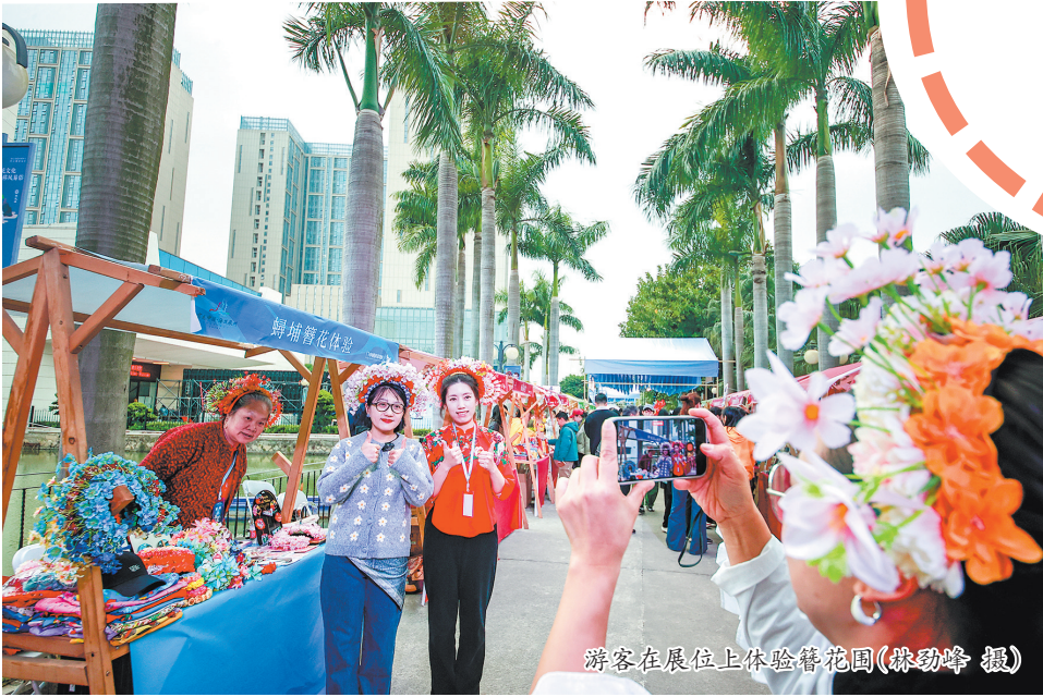
游客在展位上体验簪花围

咖、村口大树的特调饮品,本土品牌的闽南风味咖啡,一杯杯咖啡串联起不同地域的风味故事。为了让咖啡文化真正融入城市生活,咖啡节还打造了“咖啡+艺术”“咖啡+音乐”“咖啡+运动”等多元体验场景,并设计了咖啡打卡线路,鼓励游客步行或骑行探索街区,在品尝咖啡的同时,感受闽南古厝的建筑之美。据统计,活动期间五店市客流量同比增长超200%,带动周边餐饮、零售消费大幅提升,更让“来泉州喝一杯世界好咖啡”成为游客的新共识。 面包节与咖啡节等舌尖市集的火爆,并非偶然。近年来,泉州瞄准年轻消费群体的需求,以新潮市集为载体,不断丰富文旅消费场景。这些市集不仅让年轻人的消费活力持续释放,更让“泉州好吃好玩”的印象深入人心,吸引越来越多的游客前来打卡,为城市文旅注入源源不断的青春动能。