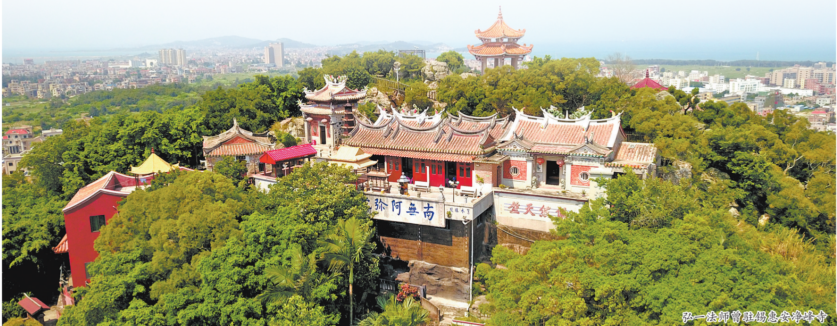
弘一法师曾驻锡惠安净峰寺