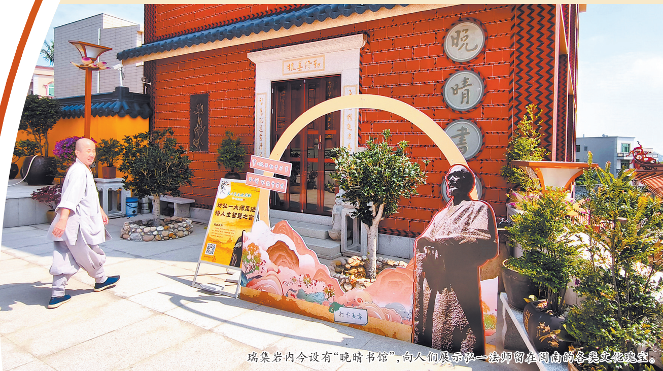
瑞集岩内今设有“晚晴书馆”,向人们展示弘一法师留在闽南的各类文化瑰宝。