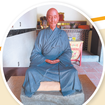
弘一法师曾到惠安善德堂为民众演讲,图为堂内的弘一法师塑像。