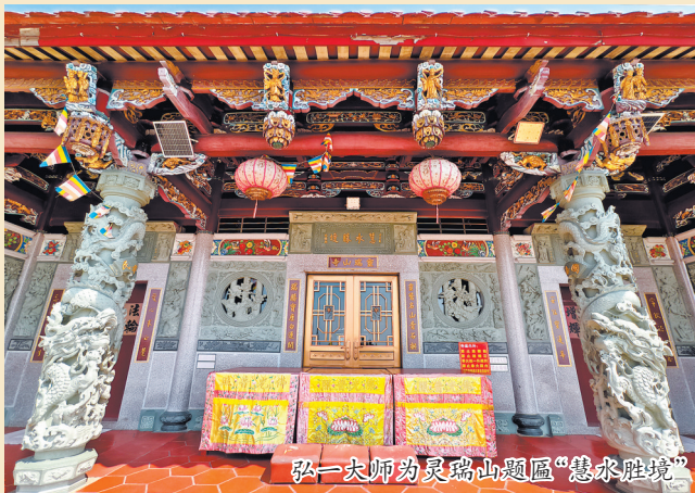
弘一大师为灵瑞山题匾“慧水胜境”