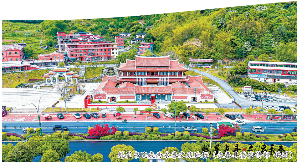
魁星书院成为永春文旅地标