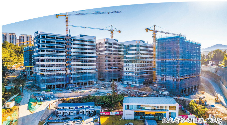
塑米智谷项目施工现场