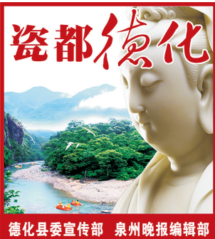
德化县委宣传部 泉州晚报编辑部