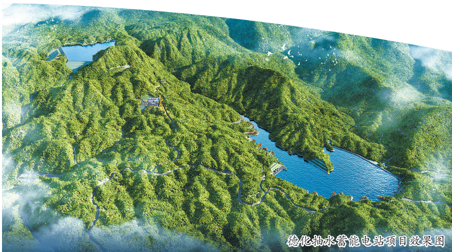
德化抽水蓄能电站项目效果图