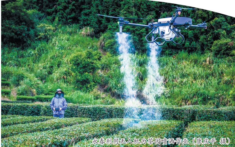
永春利用无人机为茶园喷洒作业

确,到2030年,香、瓷、醋规模以上企业数量将实现翻番,产业规模分别突破300亿元、220亿元、50亿元,打造具有全国影响力的特色产业名片。