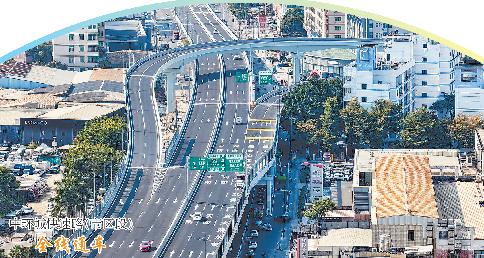
申环城快速路(市区段)

昨日我市艳阳高照,大部分乡镇午后最高气温在20℃~26℃。今日我市依旧以晴好天气为主,气温变化不大。市气象台昨日发布“海上大风预警Ⅳ级”,受冷空气影响,今日傍晚起我市沿海风力逐渐加大,今日夜间至21日沿海平均风力最大可达8级。明日起气温将明显下降,最低气温出现在23日早晨,过程降幅4℃~8℃。22日至24日夜晨气温低,德化大部、永春中西部、安溪西部、南安北部和洛江北部最低气温可达0℃~4℃(有霜或霜冻),其余地区5℃~9℃,局部高海拔乡镇可达0℃以下(有结冰)。