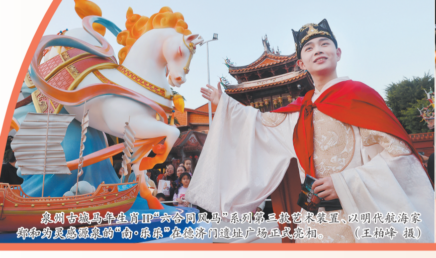
泉州古城马年生肖IP“六合同风马”系列第三款艺术装置,以明代航海家郑和为灵感源泉的“南·乐乐”在德济门遗址广场正式亮相。