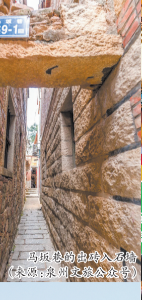
马坂巷的出砖入石墙