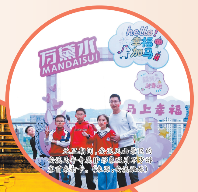
元旦期间,安溪凤山景区的安溪马年生肖IP形象吸引不少游客前来打卡。