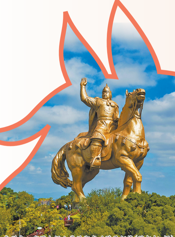
泉州中心市区大坪山巅的郑成功骑马铜像 “骐骥泽泽”亮相真武庙广场

在安溪,当地也推出了“彩虹马”的马年专属IP形象。在巧妙融合安溪藤铁工艺、茶文化及蓝印花布等非遗元素的基础上,五匹马各自承载着美好的新年愿景:“驮金负银”寓意“马上有钱”,马鞍嵌“福”传递“马上有福”,手握金粽祝愿“马上高中”,身饰山茶花象征“马上幸福”,以及脚踏腾空、后蹄踏云以平步青云之势寄托“马上封侯”。它们化身为承载安溪独特文化魅力的生动名片,邀请市民游客奔赴打卡一场“马上”安溪之旅。