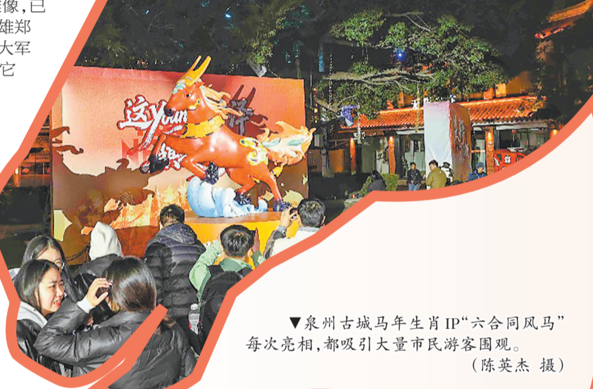
泉州古城马年生肖IP“六合同风马”每次亮相,都吸引大量市民游客围观。