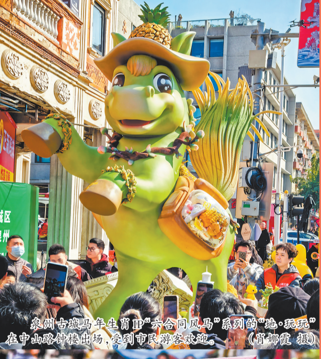
泉州古城马年生肖IP“六合同风马”系列的“地·玩玩”在中山路钟楼出场,受到市民游客欢迎。