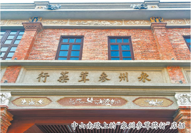
中山南路上的“泉州参茸药行”店招