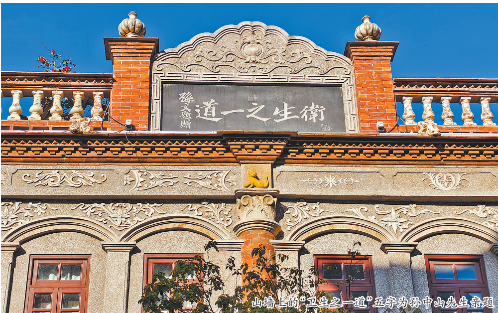
山墙上的“卫生之道”匾字为孙中山先生亲题