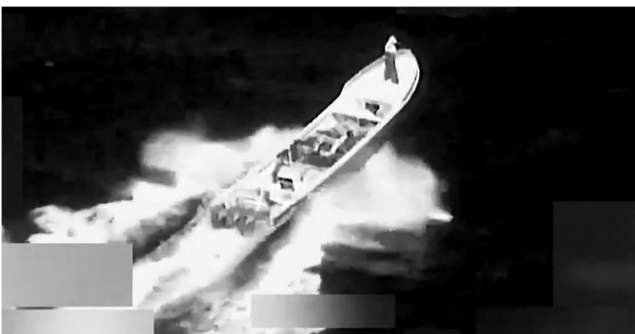
当地时间1月23日,美国“南方之矛”联合特遣部队对一艘船只实施了致命打击。美国南方司令部表示,“该船只正在东太平洋沿已知毒品走私路线航行,并参与毒品走私活动”,两名“毒贩”在袭击中死亡,一人生还。

报告说,朝鲜对韩国和日本构成直接军事威胁,同时朝鲜的“核力量越来越有能力威胁美国”。韩国有能力在“关键但有限”的美国支持下,承担起威慑朝鲜的主要责任。