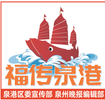
泉港区委宣传部 泉州晚报编辑部

向海而生的峰尾镇,坐拥泉港区唯一的古城。自古以来,这里既是扼守东南沿海门户的海防要塞,又是连接四方的渔商重镇和海丝节点。旧时,峰尾被称作“小上海”,不仅渔业发达,食盐、白糖、布匹等货物的贸易也往来各地,特别是民国时期,姑妈澳码头与浙江舟山沈家门之间“帆影往来、商贾云集”。 为还原这段“藏在抽屉里的历史”,日前,由当地乡贤修缮打造的“万商云居海丝馆”整饬一新,如同一座乡间博物馆,将峰尾的海丝故事在一栋百年老厝里娓娓道来。