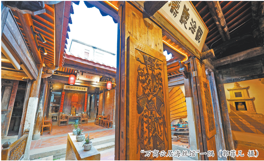
“万商云居海丝馆”一隅

向海而生的峰尾镇,坐拥泉港区唯一的古城。自古以来,这里既是扼守东南沿海门户的海防要塞,又是连接四方的渔商重镇和海丝节点。旧时,峰尾被称作“小上海”,不仅渔业发达,食盐、白糖、布匹等货物的贸易也往来各地,特别是民国时期,姑妈澳码头与浙江舟山沈家门之间“帆影往来、商贾云集”。 为还原这段“藏在抽屉里的历史”,日前,由当地乡贤修缮打造的“万商云居海丝馆”整饬一新,如同一座乡间博物馆,将峰尾的海丝故事在一栋百年老厝里娓娓道来。