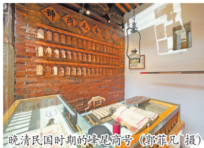
晚清民国时期的峰尾商号 (郭非凡 摄)

因对家乡、家族故事的独特感情,刘荣宁长期收藏爷爷刘华来生前经商往来的老物件。2025年10月,在沈家门徐正国博物馆探寻民国时期先辈在那里捕鱼、经商的故事后,刘荣宁打造“万商云居海丝馆”的构想愈加坚定。