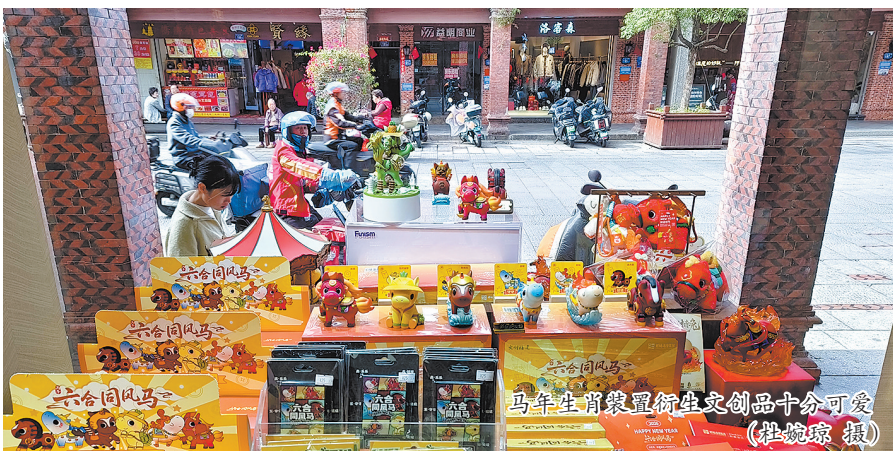
马年生肖装置衍生文创品十分可爱

据介绍,今年,鲤城区深度挖掘泉州与“马”相关的历史文脉,以俞大猷、郑成功等六位历史人物为精神原型,融合现代审美与国潮风尚,创新打造IP4.0版本,推出“六合同风马”艺术装置。目前全网累计曝光量已突破2.8亿次;IP衍生品已授权开发涵盖食品、饮品、文创、礼品等32个大类,首期产品市场总价值超过1000万元,相关商业合作收入突破200万元。