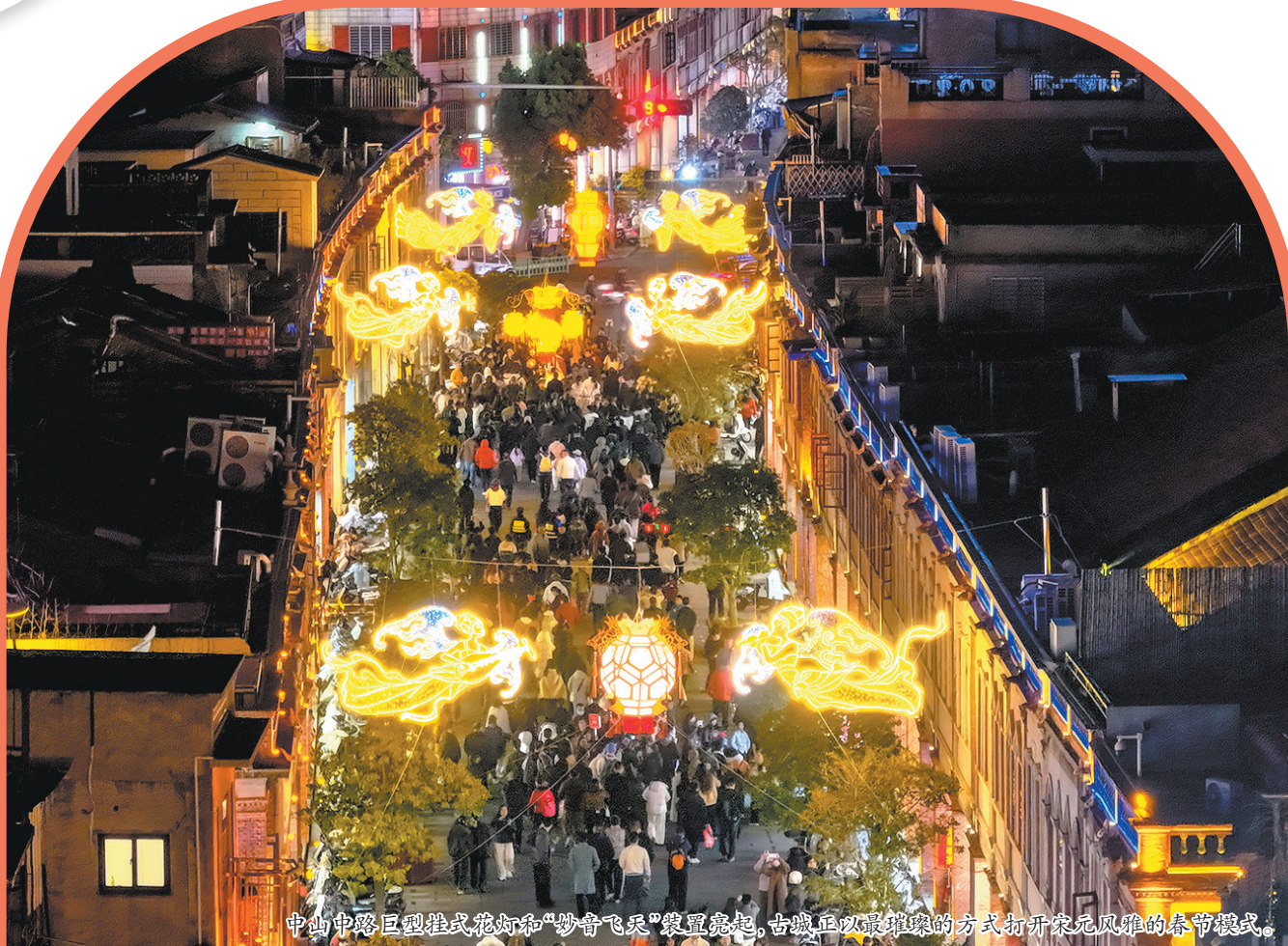
中山中路巨型挂式花灯和“妙音飞天”装置亮起,古城正以最璀璨的方式打开宋元风雅春节模式。