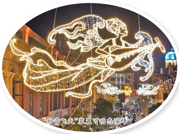
“妙音飞天”装置可动态演绎

本报讯(融媒体记者杜婉琼 陈英杰 石树停 张九强 文/图)马年春节的脚步临近,泉州古城的大街小巷开始被流光溢彩的灯光装扮。连日来,一盏盏构思精巧、匠心打造的花灯和亮化装置陆续点亮,浓浓的年味在古城的璀璨光影中弥漫开来。