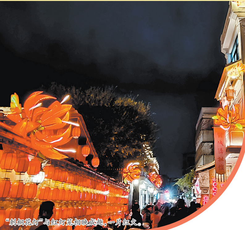
“刺桐花灯”与红灯笼相映成趣,一片红火。