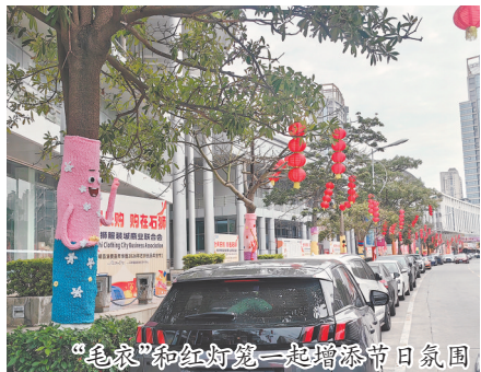
“毛衣”和红灯笼一起增添节日氛围