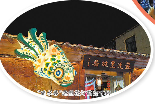
“滴水兽”造型花灯憨态可掬

中山中路两旁的骑楼下,数百盏传统非遗花灯也渐次点亮,构筑成一条流光溢彩的新春画廊。市民和游客徜徉在古城的灯光艺术中,或驻足细观“妙音飞天”,或仰头欣赏成排的传统花灯,眼里满是对新春的憧憬与期盼。