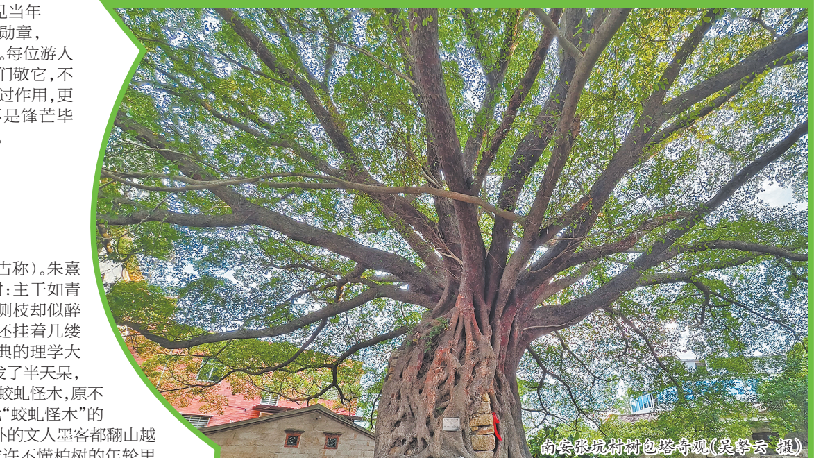
南安张坑村树包塔奇观