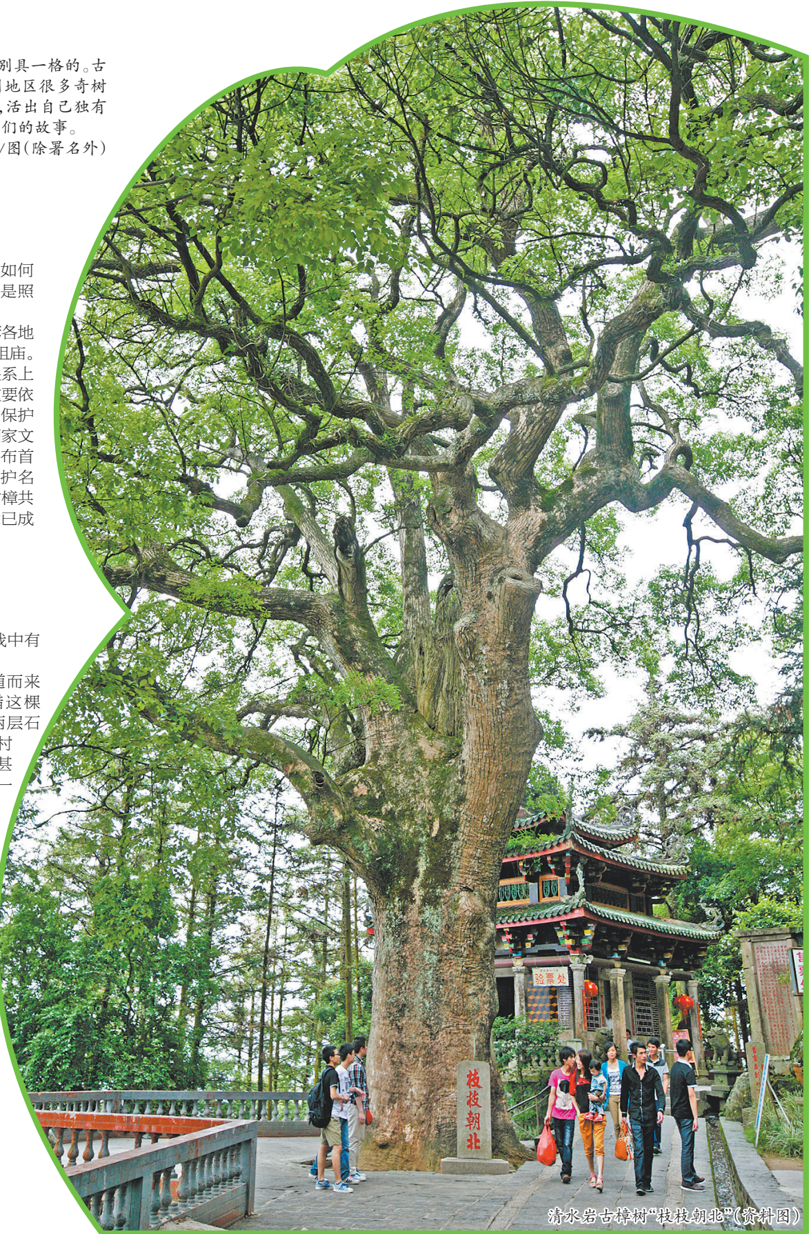
清水岩古樟树“枝枝朝北”(翁科图)

现在,这棵千年古桑树成了世界各地游客到泉州开元寺时,必然要参观的对象。它的三断三生,已成为一种传奇。它曾经承载过的一切,甚至是苦痛和磨难,也都充满了荡气回肠的魅力。古桑树伫立园中的身影,尽管并不那么笔直,并不那么青春,但曲折与苍劲之间,仍吐露了泉州城独有的刚烈、豪迈的气度。