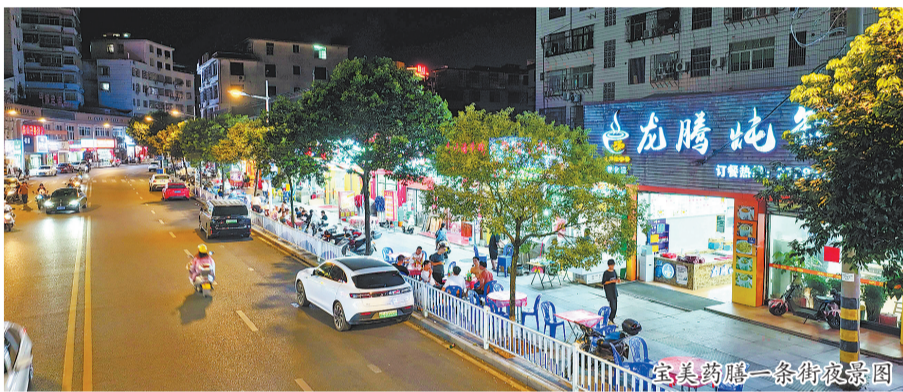
宝美药膳一条街夜景图

药膳街专注于“食以养人”的内涵，直接取用戴云山地道药材与本地优质农产品，烹制出一道道温补养生的佳肴。而“瓷都盛宴”的菜品已由原来的15道丰富至60余道，其精髓同样源于德化黑鸡、茶油羊肉等本地特色，并凭借“美食+美器”的独特理念，赋予了德化餐饮深厚的文化底蕴与鲜明辨识度。无论是北京、福州推介会上食客的赞叹，还是与米其林主厨“四手联弹”的创意碰撞，温润如玉的德化白瓷始终与本土佳肴相映生辉。“雪釉乌金”“凝脂白玉”