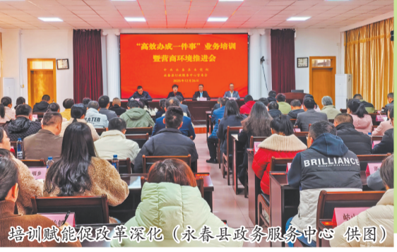
培训赋能促改革深化