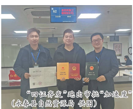
“四证齐发”跑出审批“加速度”