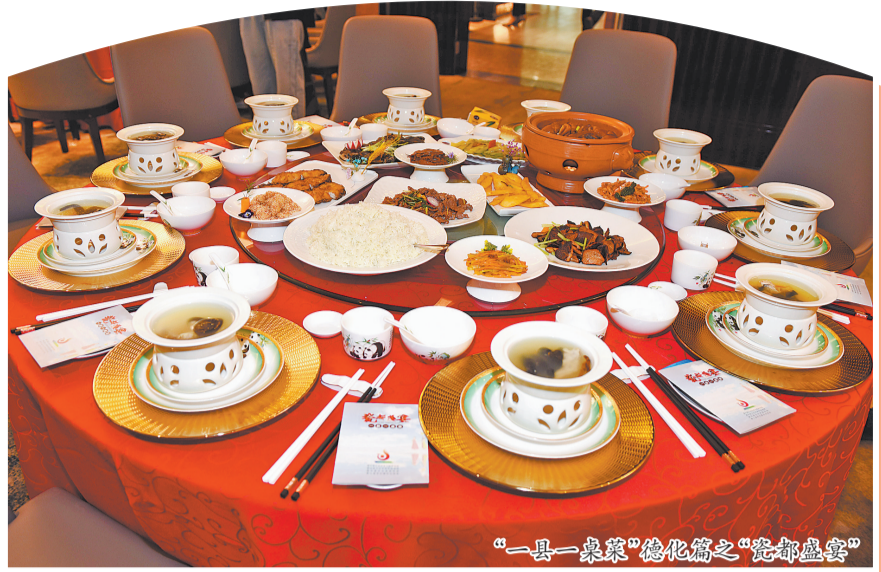
“一县一桌菜”德化篇之“瓷都盛宴”

傍晚时分，德化县龙浔镇宝美街华灯初上，缕缕药膳香气从街头巷尾悠然飘散。在宝美源大酒家，一份遵循古方配比的“降糖甲鱼”被端上餐桌，盛载它的正是温润如玉的德化白瓷盘。不远处，梅园大酒店内，食客们正细细品味着“牛奶籽猪脚”……这条全长763米、汇聚百余家店铺的特色街区，集药膳文化传承、特色餐饮发展与健康养生推广于一体，于2024年荣获“福建省特色步行街”称号。它不仅是本地人日常青睐的养生厨房，更是外来游客感知德化生态之美与品味文化之韵的一扇鲜活窗口。 近年来，德化县以推广“瓷都盛宴·一县一桌菜”为契机，进一步完善街区配套设施，重点推进宝美福味药膳文化步行街、水口镇药膳美食街等争创省、市级特色商业街区建设，并通过常态化开展烹饪大赛、星光夜市、厨艺培训等美食文旅活动，为街区发展注入持续活力。