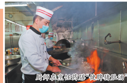
厨师在烹饪药膳“健脾胃肚汤”