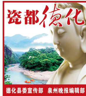
德化县委宣传部 泉州晚报编辑部