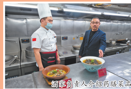
酒家负责人介绍药膳菜品