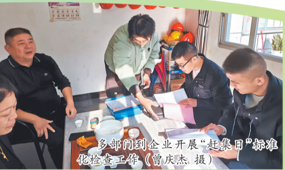
多部门到企业开展“赶集日”标准化检查互评。

从刚性监管到柔性服务，从被动审批到主动赋能，永春优化营商环境奏响的是政府职能转变的强音，激发的是市场主体蓬勃的活力。2025年，永春固投连续三年超百亿元，重点项目考评跻身全省前十，荣获全省经济发展“十佳”县，一批创新型企业加速集聚。白鸽在线在港交所挂牌，实现上市企业零的突破；良瓷科技获评国家级5G工厂；引进29家大湾区企业，电子信息产业链从无到有；新材料产业链加