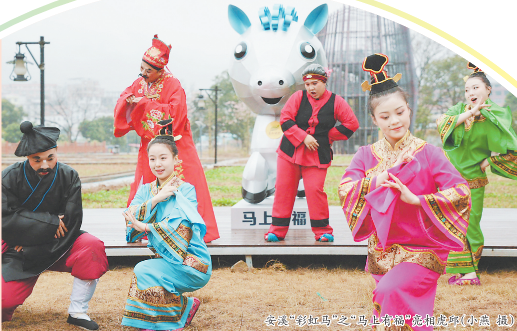
安溪“彩虹马”之“马上有福”亮相虎邱