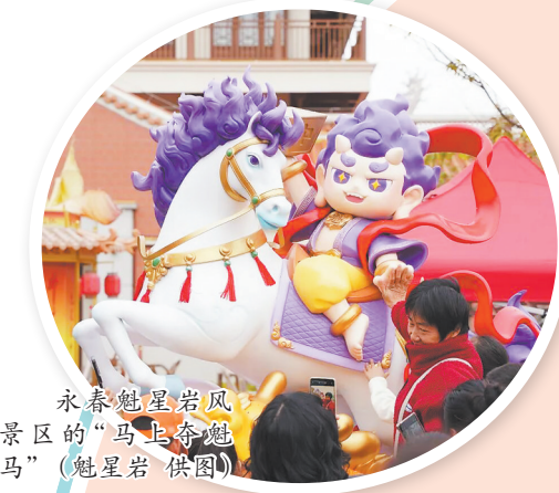
永春魁星岩风景区的“马上奇魁马”