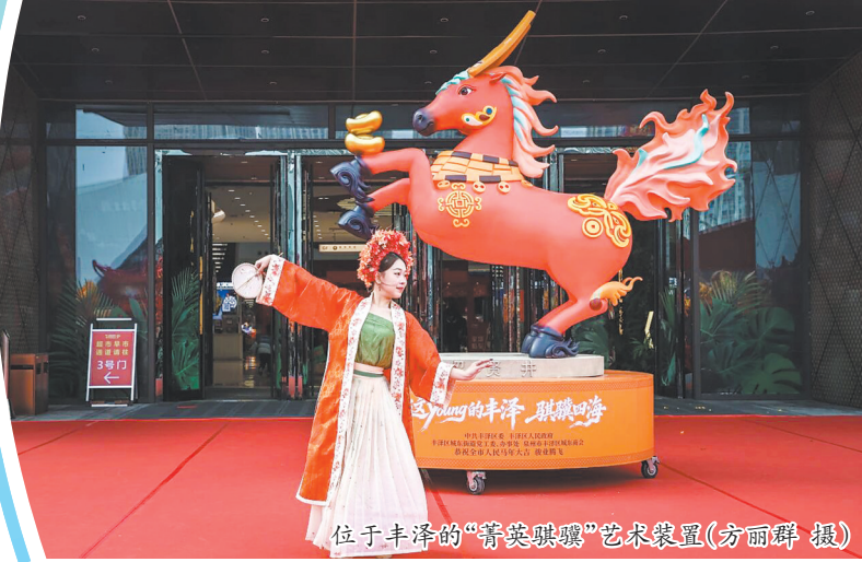
位于丰泽的“清溪骐驎”艺术装置