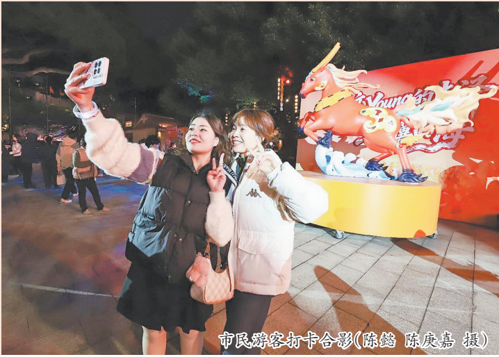
市民游客打卡合影