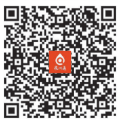
扫描二维码 阅读专栏作品

人才兴则乡村兴,人才强则乡村强。洛江区的文化特派员、文化巡研员制度通过人才下沉、资源整合,既夯实了乡村的文化根基,也为激活乡村文化动能、破解乡村发展难题提供了无限可能,更让文化赋能乡村振兴的“洛江实践”异彩纷呈。