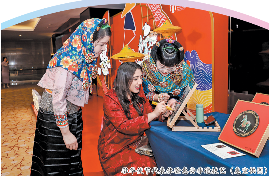
驻华使节代表体验惠安非遗技艺

本次“惠安之夜”内容丰富多样,通过播放惠安宣传片、惠女走秀、美食品鉴、非遗互动等,全方位、立体化展示惠安的文化瑰宝与现代活力,旨在充分挖掘惠安特色资源与文化底蕴,系统打造“惠女家宴”作为惠安对外形象展示与文化传播的核心载体。其中,“惠女繁花胜