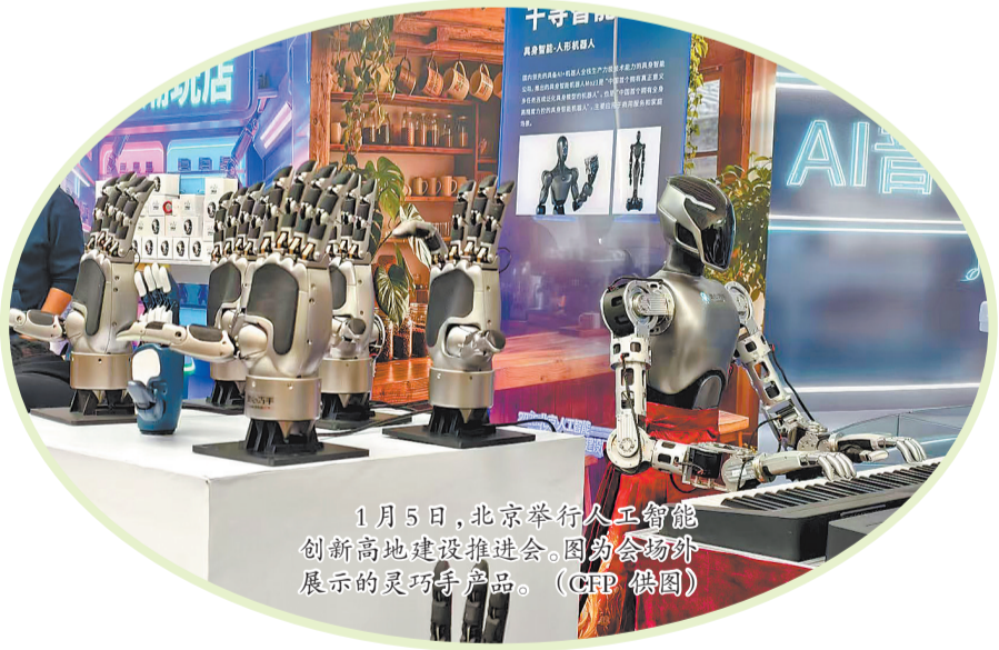
1月5日,北京举行人工智能创新高地建设推进会。图为会场外展示的灵巧手产品。

除了在软件领域发挥作用,AI与成熟产业链的结合,催生了制造业领域独特的“手搓党”现象。在短视频平台上,“手搓万物”话题播放量超50亿次。深