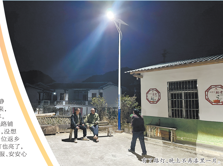
有了路灯,晚上不再漆黑一片。