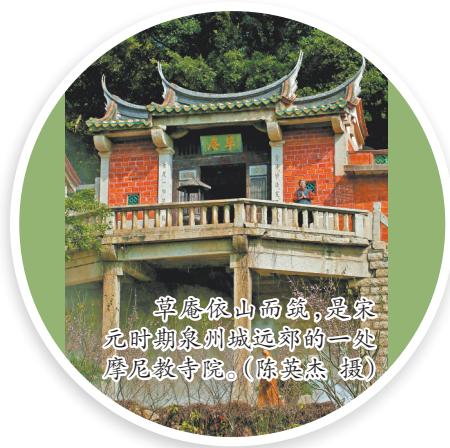
草庵依山而建,是宋元时期泉州城郊的一处摩尼教寺院。

晋江草庵是泉州22处世界遗产点之一。在这里,大家可以瞻仰世上仅存的摩尼光佛石雕造像,感受宋元时期泉州作为世界海洋商贸中心所展现的文化包容力;欣赏这座依山崖而建的石构单檐歇山式建筑,领略其古朴精巧;品味弘一法师为草庵题写的藏头门联,了解他与这座古寺的深厚法缘;或驻足于千年古松树下,感受古树的生命力。此外,还可以漫步后山,寻访“万石峰”“玉泉”“云梯百级”等历代摩崖石刻,开启一场深度文化之旅。