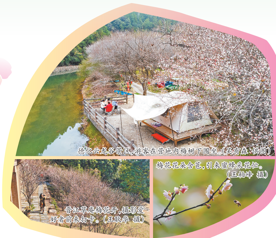
德化云龙谷景区,游客在营地内梅树下围坐。