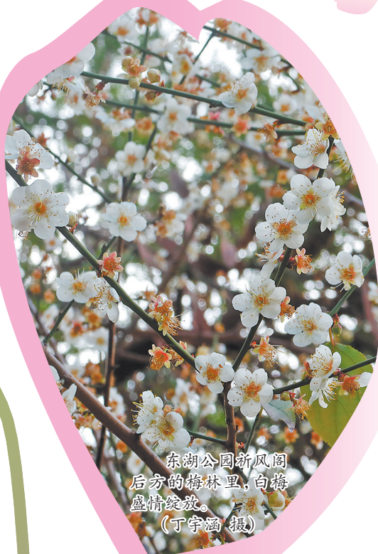
东湖公园新风阁后方的梅林里,白梅盛情绽放。

暗香浮动,疏影横斜。立春过后,泉州多处梅花绽放枝头,为即将到来的马年捎来融融春意。不妨趁着这般绝佳“梅”景,开启一场赏梅迎春之旅。赏花之余,还可以带娃游园、品鉴美食、探访世遗、感受年味,领略这份“季节限定”的惬意美好。 □融媒体记者 洪娜娜