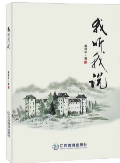
《我听我说》秦建华著 江西教育出版社

散文集《我听我说》还有两个突出特点,其一是它是一部融媒体作品。书中既有诸多精美图片,每个小辑还有视频欣赏,每篇文章都录制成了音频,读者扫码点击观看或收听就能感受到文字的另一魅力表达。其二是全书收录的文章篇幅都不长,文字显得十分精炼。阅读《我听我说》,读者将快速进入一个“有我”的世界,在“我”的世界里尽情欢愉,你或许会收获一座骑楼、一处风景,一段奇缘,还有说不完的故事。