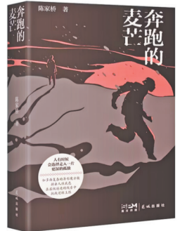
陈家桥 著 花城出版社

作家陈家桥以一部结构精妙的社会推理力作,将读者带入皖南小镇“广城吸”的迷局之中。中年失意的四猫因父亲病重回乡,却卷入发小被杀案,成为嫌疑人。神探杜辉的调查,如同剥开小镇的层层外壳,让每个返乡者不堪的过往与现实的算计暴露无遗。小说采用多声部叙事,将当下命案、尘封旧案、家族史与地域史嵌套交织,在看似平淡的叙述下构建起一座叙事迷宫,直指人性的复杂与命运的吊诡。