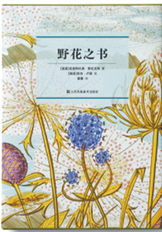
[英]克里斯托弗·斯托克斯 著 [英]安吉·卢因 绘 雷玺 译 江苏凤凰美术出版社

这本来自英国的优雅小书,邀请你重新发现身边被忽视的野性之美。从蒲公英到贝母,从三叶草到雪滴花,作者克里斯托弗·斯托克斯不仅介绍了这些常见野花的辨识特征、药用价值与古老传说,更揭示了它们适应环境的非凡智慧。配以版画家安吉·卢因富有表现力的精美插图,本书是一次对微观世界的诗意礼赞,教会我们如何在一花一草中,找到整个世界的生动与惊奇。