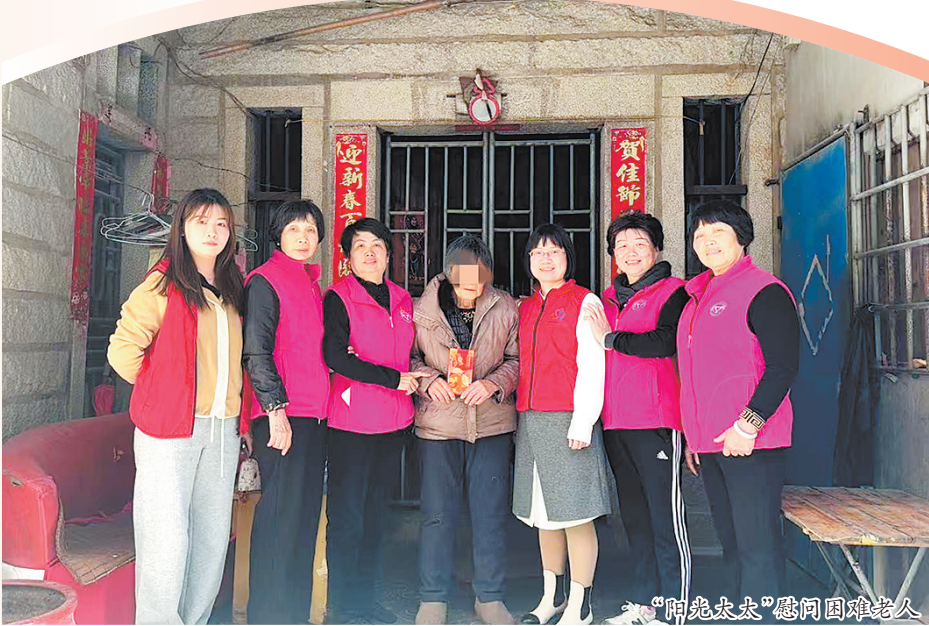
“阳光太太”慰问困难老人