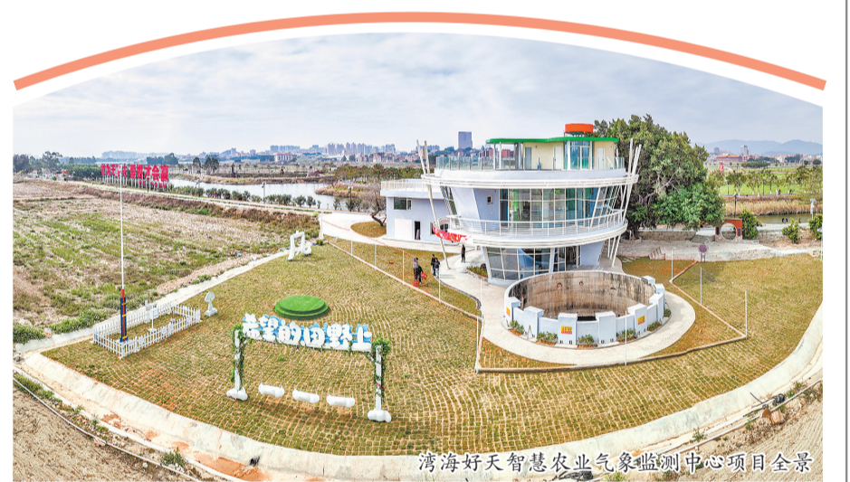
湾海好天智慧农业气象监测中心项目全景