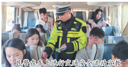
民警在车上进行交通安全流动宣教

本报讯(融媒体记者张文琛 通讯员庄晓峰 张希达 文/图)日前,惠安县公安局交警大队积极推行“暖心服务+安全宣教”双向发力的工作模式,为春运返程路保驾护航。