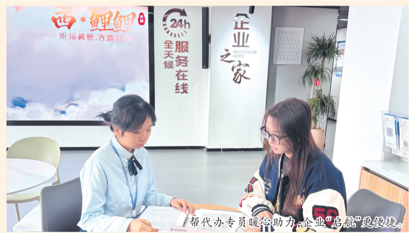
帮代办专员暖心助力,企业“启航”更便捷。

本报讯(融媒体记者李艺深 通讯员何紫薇 文/图)“鲤城‘企业之家’把我们的事当成了自己的事来办,真是切实为我们企业着想。”“在这里,能感受到服务不仅有速度,更有温度。”……鲤城区政务服务中心“企业之家”自去年2月投入运营以来,得到了不少企业点赞,被称为企业信赖的“贴心管家”。该平台以企业需求为导向,贯通空间与数字双轨服务,致力于为企业提供从设立到注销、从运营到拓展的全方位、一站式服务,赋能企业全生命周期成长,是鲤城区深化“放管服”改革、推动政务服务从“能办”向“好办、易办、智办”转型升级中迈出的又一标志性步伐。