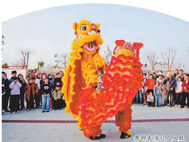
舞狮表演引人入胜

女舞龙·山海共福”“千年非遗·湖”等一系列活动,让市民游客童叟线狮”“英哥踏春·震烁东共享新春盛宴。