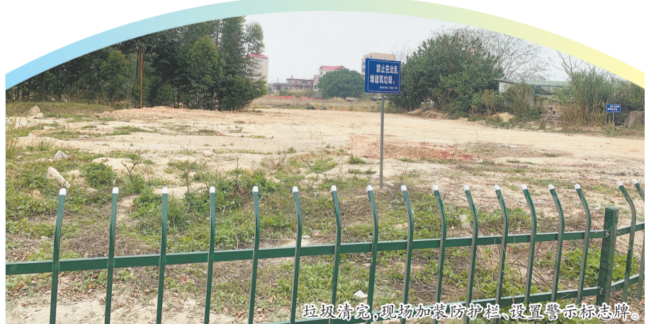
垃圾清完,现场加装防护栏,设置警示标志牌。

官桥镇政府相关工作人员还表示,下一步,镇村两级将加强常态化巡查,严防此类现象再次出现。