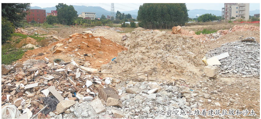
之前空地上堆着建筑垃圾和沙子。