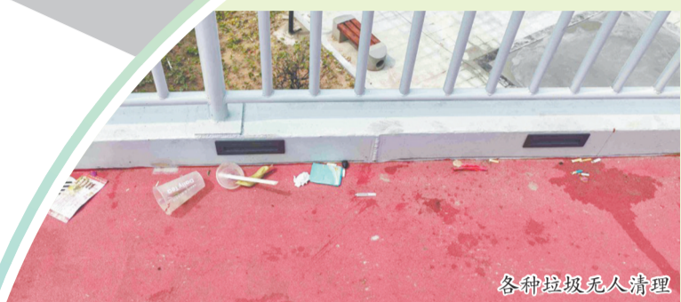
各种垃圾无人清理