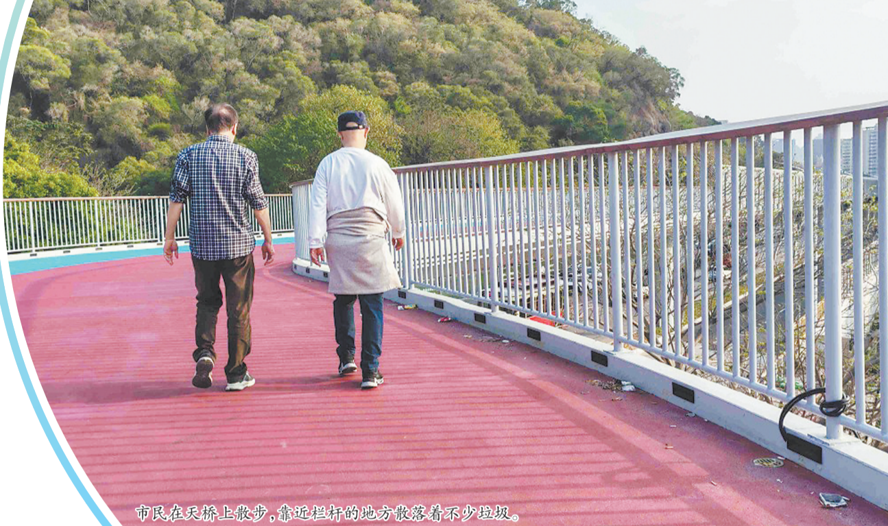
市民在天桥上散步,靠近栏杆的地方散落着不少垃圾。