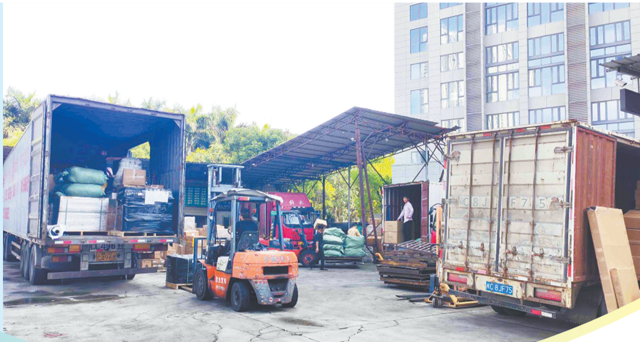
油价上涨,物流基本为油车,影响较大;末端快递配送为三轮车或电车,影响较小。

而快递的末端配送主要依靠三轮车、电动车完成,仅少量货车用于总部快件转运。多位快递网点负责人表示,短途转运与“最后一公里”派送多使用电动车辆,因此受油价调整影响相对较小,快递派送费用及寄件价格目前均保持稳定。