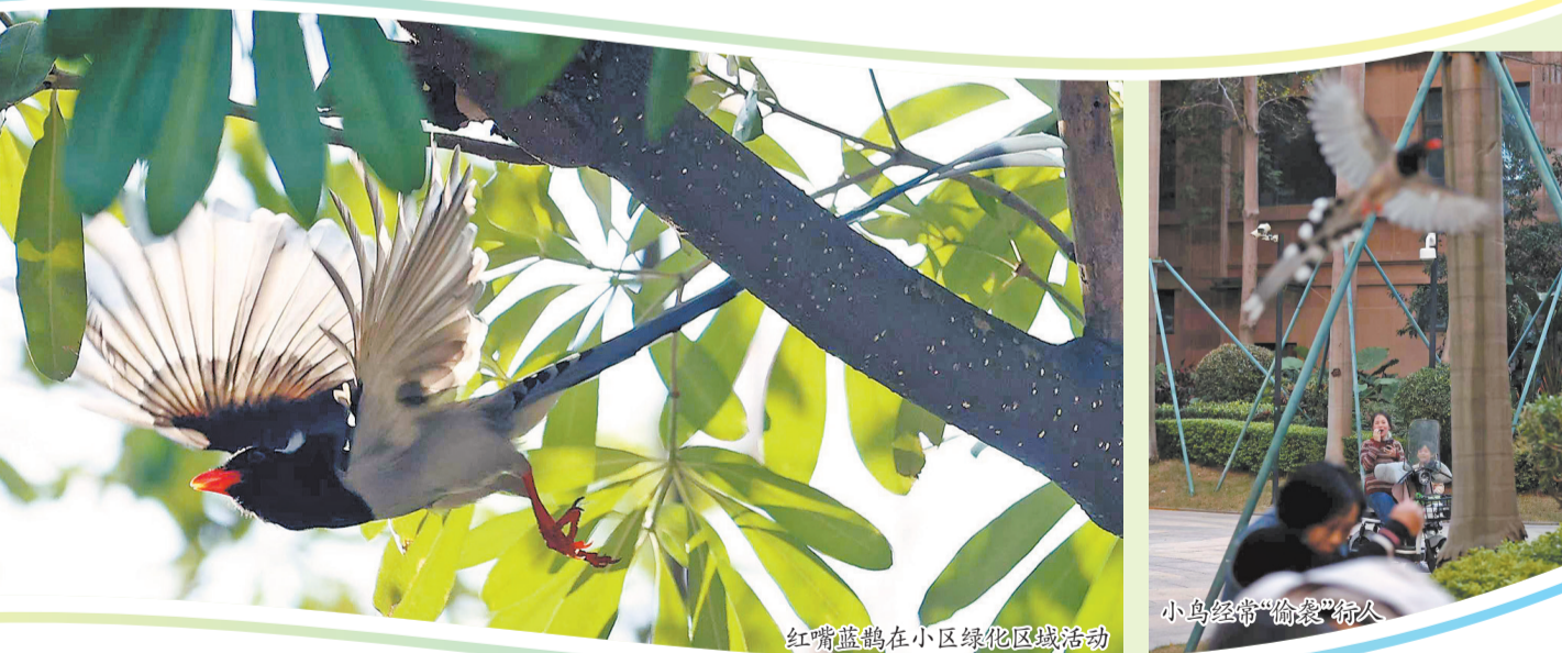
红嘴蓝鹊在小区绿化区域活动