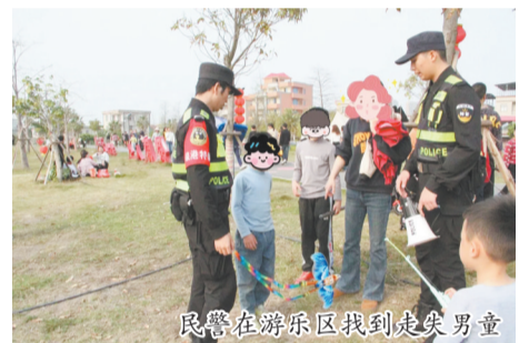
民警在游乐区找到走失男童

这场快速寻人的背后,是泉港公安分局未雨绸缪、精准施策的大型活动安保防线。据了解,此次露营季活动规模大、游客多,加之公园水域众多、地形复杂,安保工作面临不小挑战。为确保活动全程平稳有序,泉港公安分局提前结合场地实际情况,整合驻点执勤、路面巡逻、群防群治、空中无人机等多方执勤力量,量身定制专项安保预案,构建起“全域覆盖、多维联动”的立体化安保体系,全面做好现场秩序维护、应急处置、安全防范等各项工作,有效消除各类风险隐患,守护春日花海里的平安祥和。