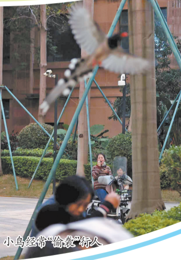
小鸟经常“偷袭”行人