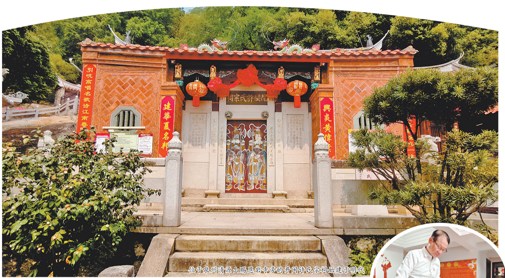
位于泉州清源山赐恩岩寺旁的开闽许氏宗祠始建于明代

这里许稷所说的话,还有另一个版本。在南宋枢密使曾从龙所撰《赐恩谱·序》:“(许稷)少与陈舍人羽等会饮,语语轻之。先生曰:‘大丈夫当为宇宙间完人,非但为科第人而已也。’言毕投杯于地,入终南山隐学三年。”虽然言辞略有不同,但意思相差不多。