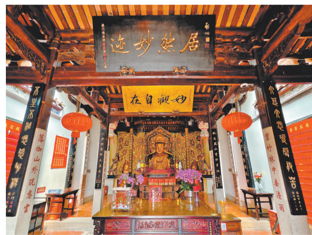
“赐恩岩寺”内的观音像鑄于北宋