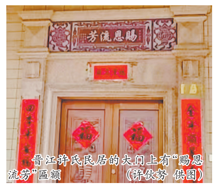
晋江许氏民居的入门上有“赐恩流芳”匾额

物保护单位;2025年12月公布为第十一批省级文物保护单位。宗祠大门两边石柱上镌有清代名士庄一俊所书楹联:“华族元初昭代更题新额,青山恩赐唐时已得旧名。”道出了祠堂的深厚历史底蕴。大门廊内左侧墙壁上镶嵌着许稷的名诗《游九鲤湖诗》,右侧则是他的《江南春三首》,为清末民初名家曾道所书,字迹遒劲有力,与宗祠的古朴氛围相得益彰。清代泉州名士苏大山在《重修赐恩岩唐刺史君苗祠》一文中称:“当先生啜酒而出,三年一鸣,浩然之气,塞乎天地。”笔锋所至,字字皆含剑鸣。许稷的“破茧成蝶”之路,也在这样的描绘当中,绽放绚烂光芒。