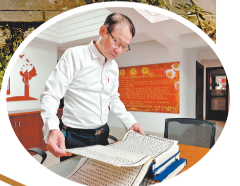
许伙努先生正在查阅许氏族谱