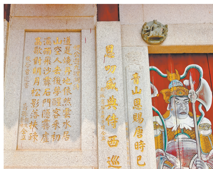
开闽许氏宗祠门廊内铸有许稷之诗