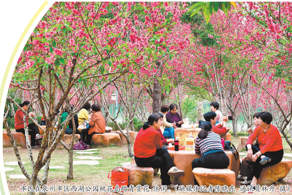
市民在泉州市区西湖公园桃花岛踏青赏花、休闲。

市文旅局有关负责人介绍说,今年春季赏花游跳出传统单一观光的局限,朝着业态创新多元化、文化赋能场景化、城乡联动全域化的方向全面升级,亮点突出,各地的创新实践也让赏花经济更具活力。刚过了春节假期的旅游高峰,“五一”假期出游高峰暂未到来。当下,正是错峰出游的好时机。错峰游不仅为游客提供了更具性价比的出行选择,也为旅游市场注入新的活力。