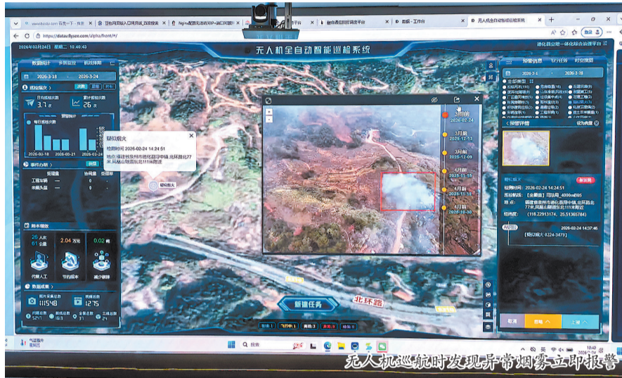
无人机巡航时发现异常烟雾立即报警

本报讯(融媒体记者陈明华 通讯员许华森 文/图)春日春耕全面铺开、清明祭扫人多,野外用火进入高发期。作为泉州市森林资源第一大县,德化县创新打造无人机智能巡护体系,落地低空示范区建设,以“一网四平台”智治体系实现全域治理数字化升级,用科技力量筑牢生态安全与民生平安屏障。