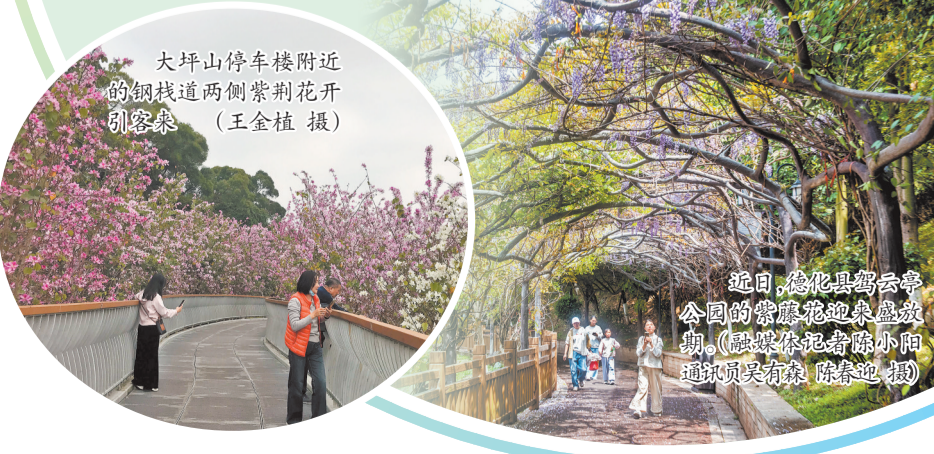
大坪山停车楼附近的钢架道两侧紫荆花开引客来。