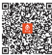
扫码查看 具体公交信息

明祭扫专线,于4月5日正式运营,保障群众祭扫出行。南安市闽兴公交公司将于清明期间根据客流实际情况,适时调整106路、126路班次及发车时间。4月4日至4月6日期间,安溪临时开通恒兴车站至殡仪馆的定制公交线路,全程免费乘坐。永春闽兴公交公司将于4月3日至4月7日开通“汽车站—西山陵园”临时公交线路。