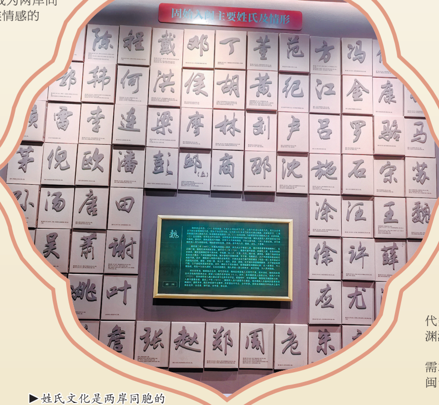
姓氏文化是两岸同胞的血缘印记,图为姓氏展示墙。

这种以姓氏为纽带的宗族传承,跨越了海峡的地理阻隔,成为两岸同胞认同中华文化、维系民族情感的核心根基。