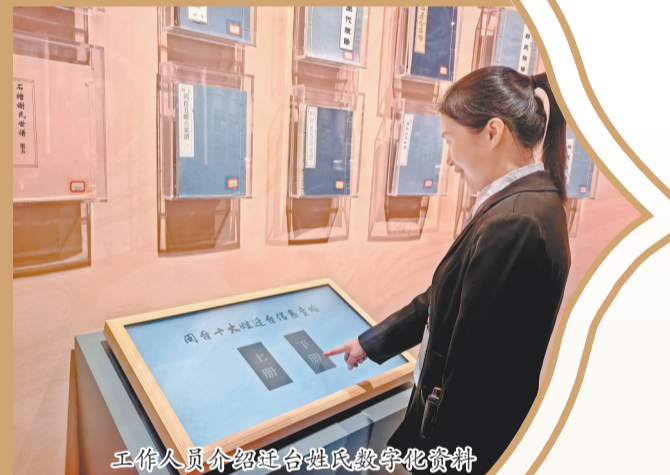
工作人员介绍台胞姓氏数字化资料