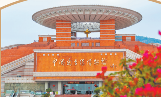
在中国闽台缘博物馆,闽台姓氏、宗族文化相关藏品极为丰富。