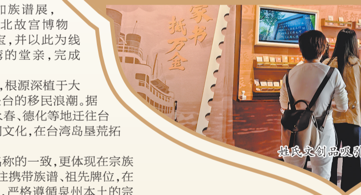
姓氏文创品吸引年轻人