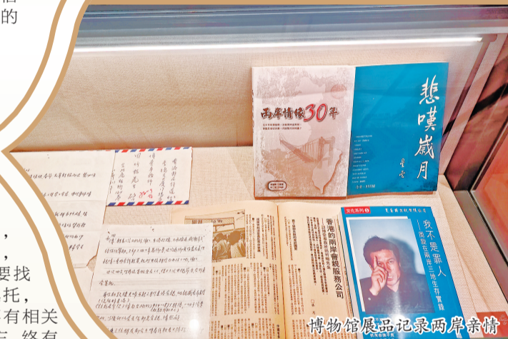
博物馆展品记录两岸亲情