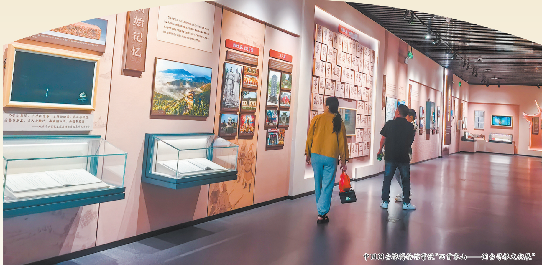
中国闽台缘博物馆常设“回首家山——闽台寻根文化展”