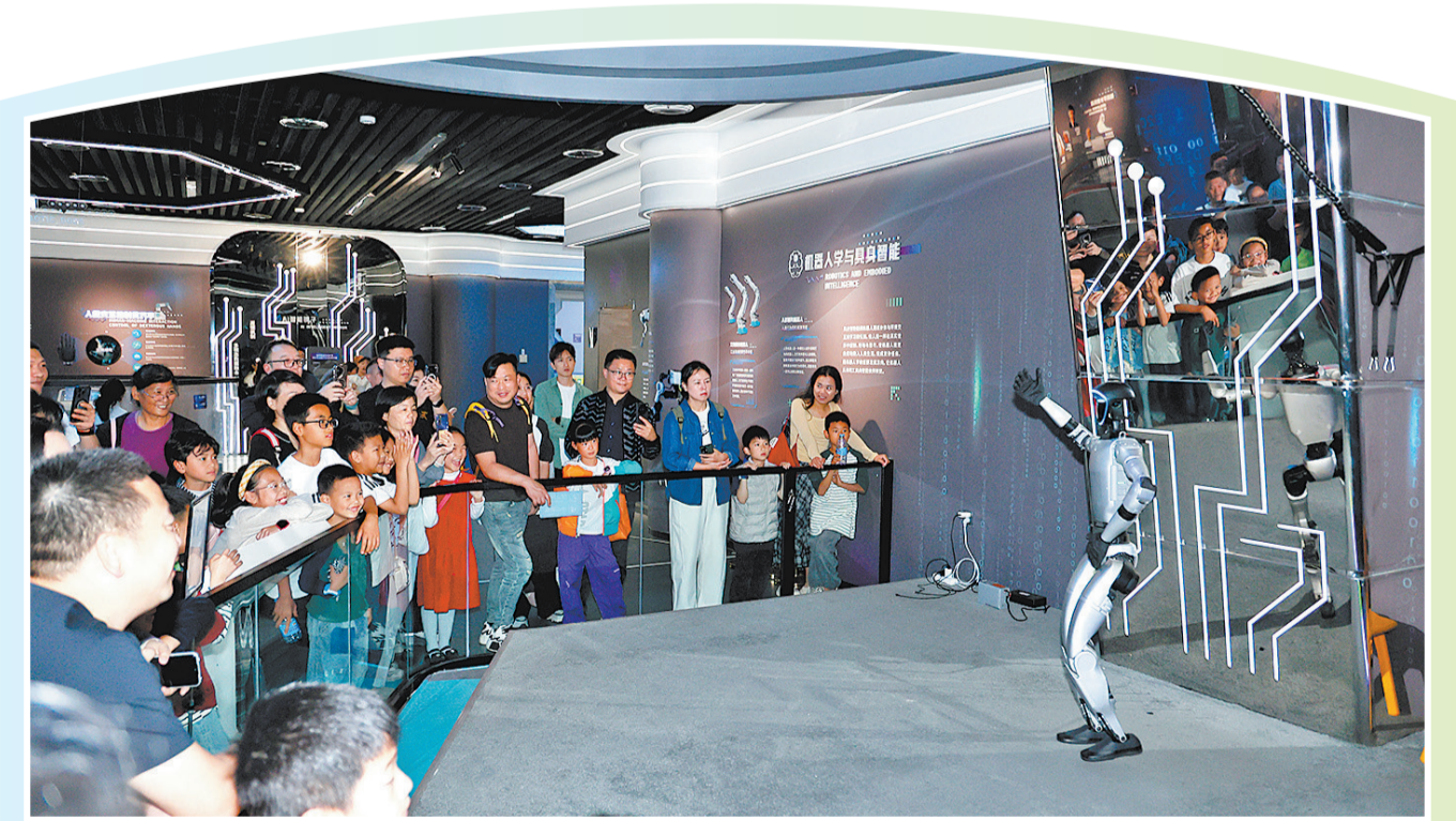
感受科技魅力 昨日上午,天气晴好,不少市民趁着假期带着孩子到泉州市科技馆参观。图为机器人表演吸引大家围观。

怀着一颗同样的心——不忘来处,不敢忘本。对无数海外游子而言,清明回乡扫墓,既是对先人的告慰,也是对自身文化身份的确认。这份跨越山海的牵挂已融入血脉,年复一年,生生不息。(泳红)