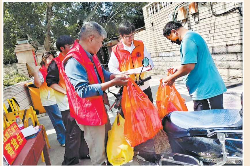
4月5日,在丰泽区北峰街道群山区组织的清明节“守护青山、文明祭扫”活动中,丰泽作协·老太婆·梦彩公益、群山区党员志愿服务队及泉州信息学院部分志愿者在群山区玉蓉路卡点协助社区工作人员,为上山祭扫的群众发放防火宣传手册,提供烟花爆竹等易燃物品存放保管服务,让群众无忧上山祭扫。