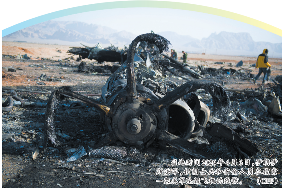
当地时间2026年4月6日,伊朗伊斯兰革命卫队成员在检查一架被击落的伊朗军机的残骸。

美国总统特朗普7日在社交媒体上发文威胁伊朗称,“今晚,整个文明将消亡,且将永无复返之日”。特朗普写道:“我不愿这样的事情发生,但它或许会发生。”特朗普称,“今夜,我们将揭晓答案。” 央视记者当地时间7日获悉,美国白宫否认正在考虑在伊朗使用核武器。 此前,路透社7日援引一名伊朗消息人士的话说,伊朗拒绝与美国达成“任何临时性停火”。