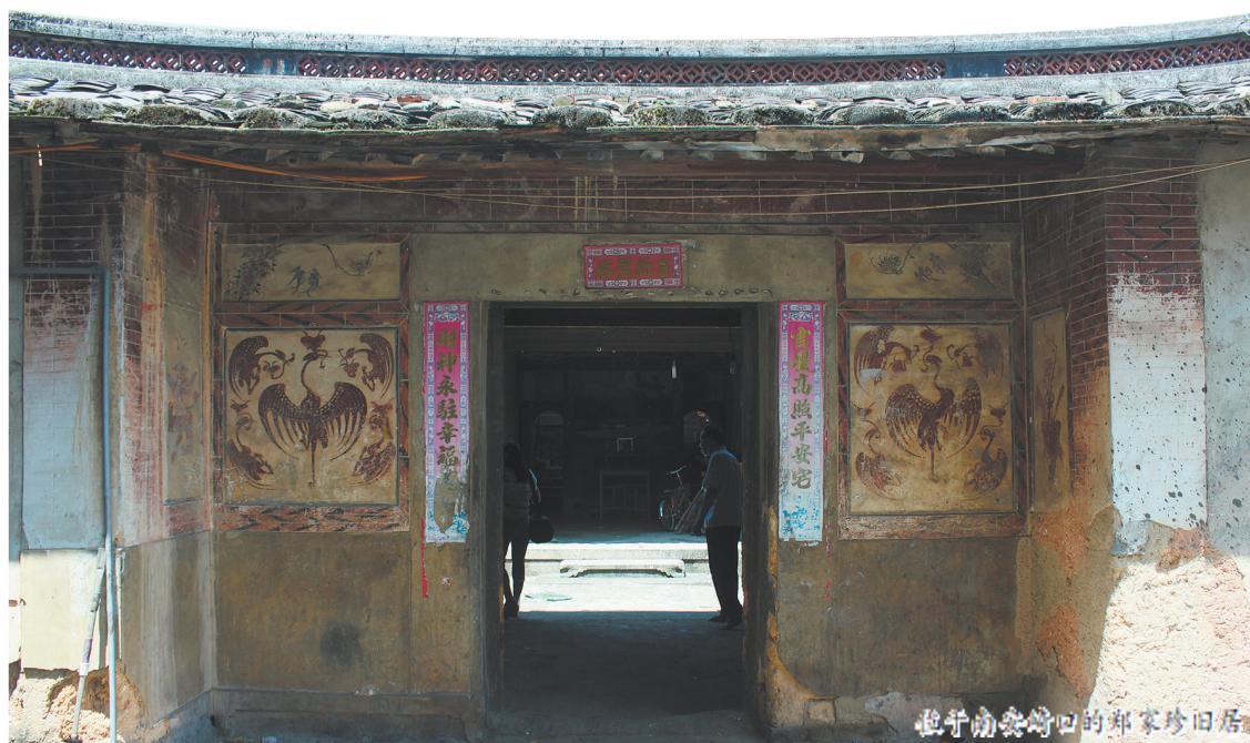
位于南安崎口的郑家珍旧居