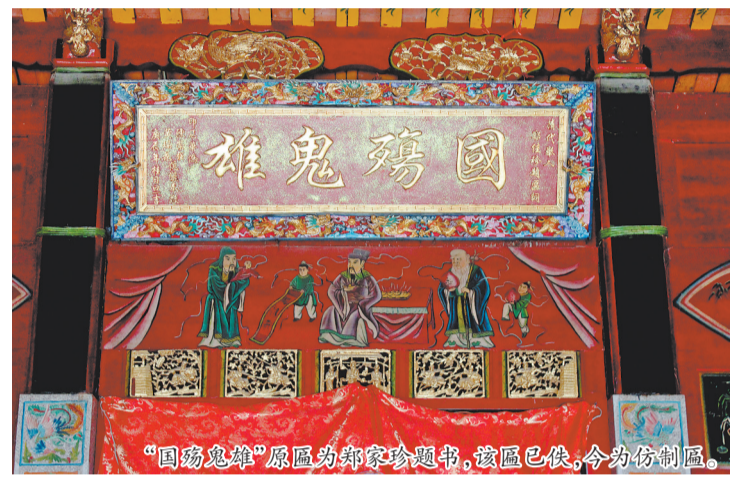
“国殇鬼雄”原匾为郑家珍题书,该匾已佚,今为仿制品。